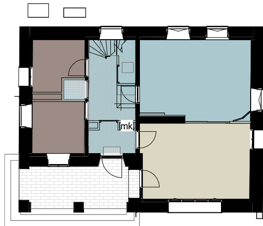
1 NT_0.0_Begane Grond (P=0) GO 1 : 200