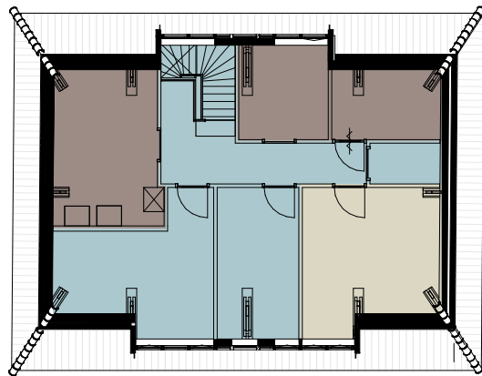
2 NT_1.0_Eerste Verdieping (P+3350) 1 : 200