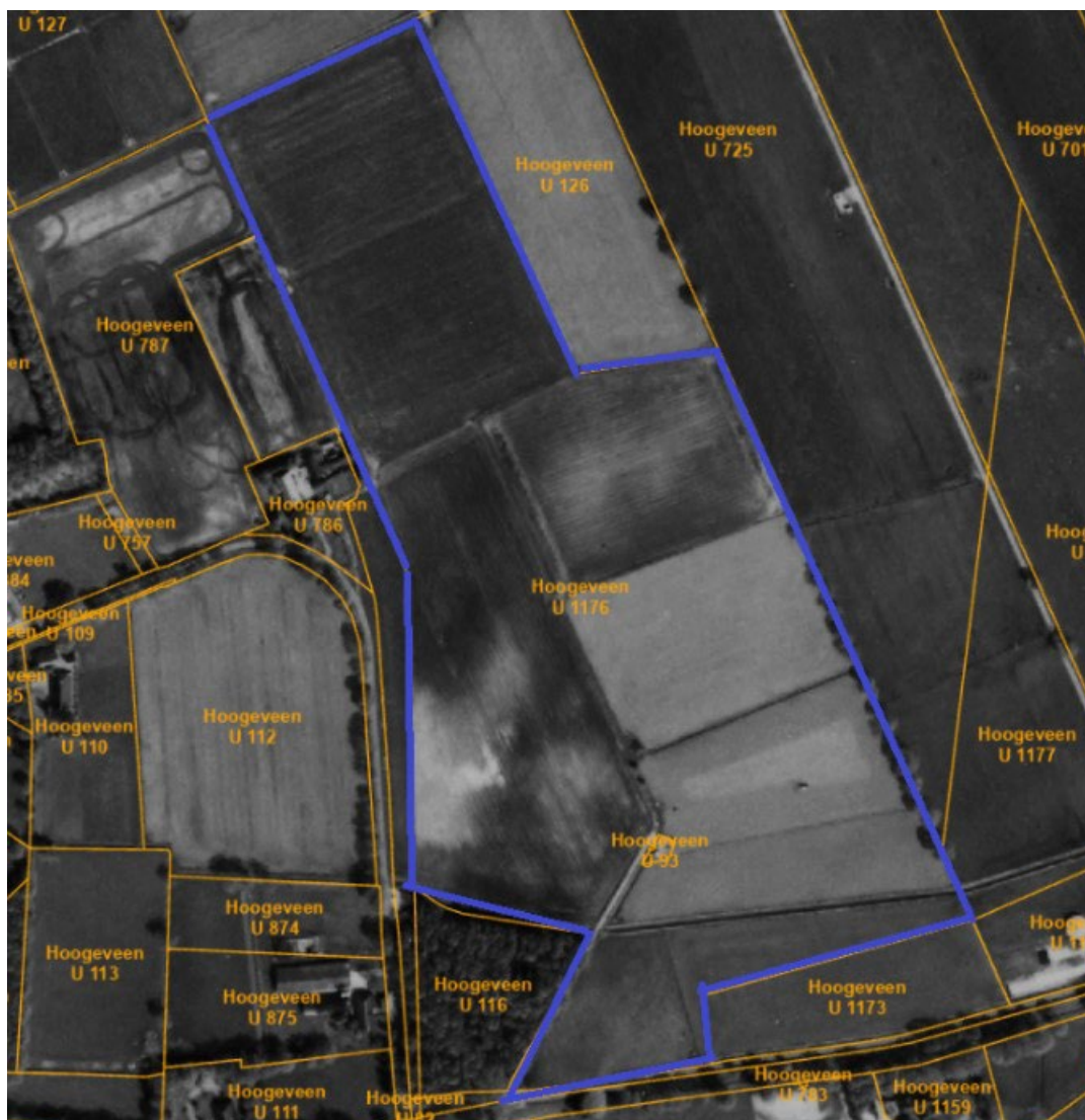
Hoogeveen U 1176 (voorheen Hoogeveen U 154)