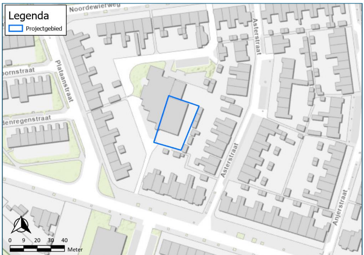
Figuur 1. Ligging projectgebied

Fout! Verwijzingsbron niet gevonden. 1 Fout! Verwijzingsbron niet gevonden.