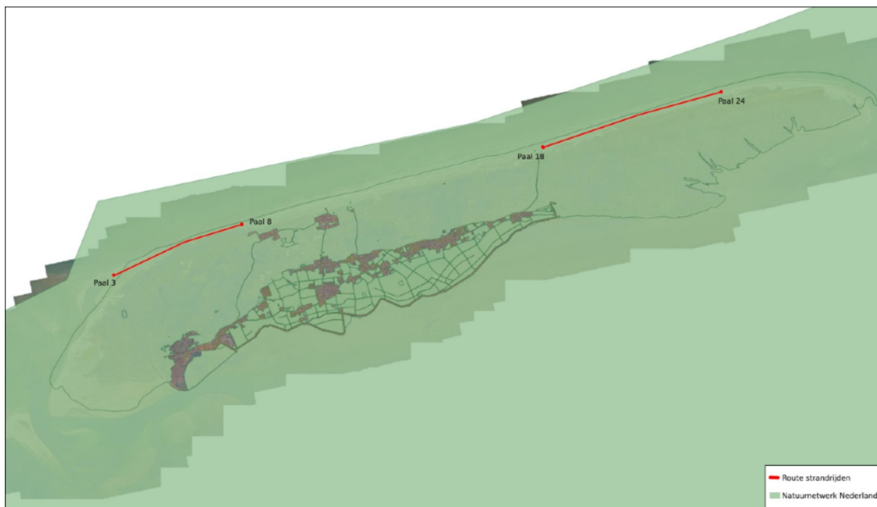
Afb.3: Voorgenomen Strandrij-routes (globaal) t.o.v het natuurnetwerk Nederland (NNN).

De begrenzingen die door de Provincie Friesland zijn vastgesteld in het kader van het Natuur Netwerk Nederland komen in het plangebied (afb.4) overeen met die van de Wet natuurbescherming. Bebouwde gebieden vallen buiten de begrenzing van het Netwerk. De route waarover langs de vloedlijn gereden wordt alsmede de visgronden in de branding maken deel uit van het NNN. De regelgeving van het NNN heeft echter uitsluitend betrekking op ruimtelijke ingrepen met een permanent karakter en niet op het gebruik van de ruimte zonder permanente ruimtelijke ingrepen. Daar activiteiten (strandrijden en vissen in de branding) geen ruimtelijke ingreep inhouden maar een vorm van gebruik, is geen sprake van strijdigheid met het NNN. De randvoorwaarden die in het kader van de andere wetgeving aan het gebruik worden gesteld zorgen ervoor dat het tijdelijke gebruik van de oesterbank geen strijdigheden opleveren met de regelgeving van het NNN. Een analyse van de effecten in het kader van het NNN is daarmee niet nodig.