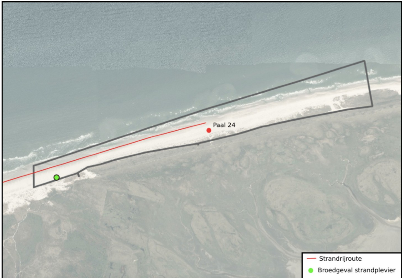
Afb.6: Broedgeval bontbekplevier op strand tussen paal 8 en paal 3.