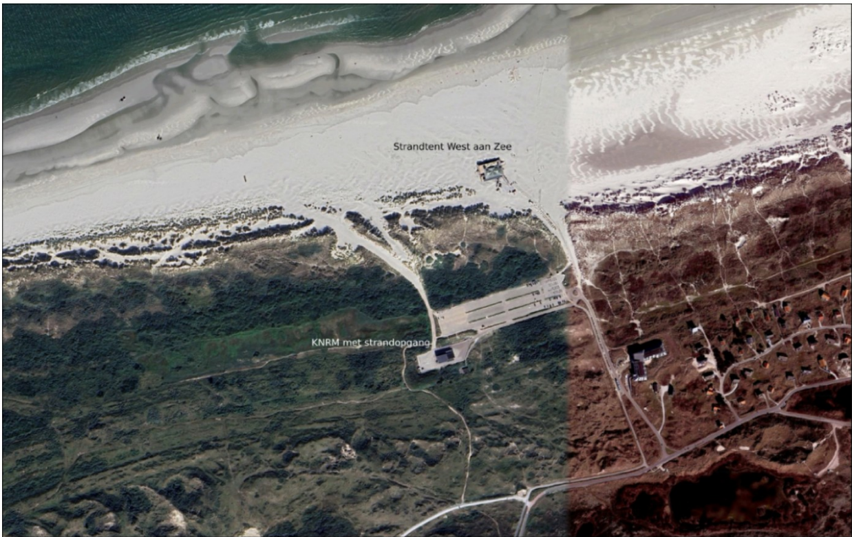
Afb.6: Strandopgang bij paal 8. Op dit intensief gebruikte stuk strand zijn geen bezwaren op het te water laten van een boot met auto en aanhangwagen.