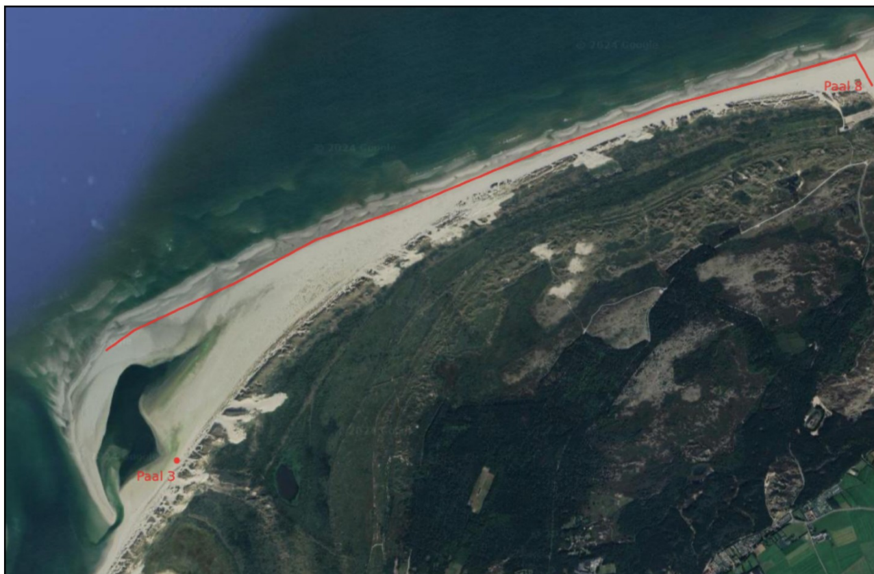
Afb.1: Ligging van het voorgenomen te berijden strand van paal 8 t/m paal 3.