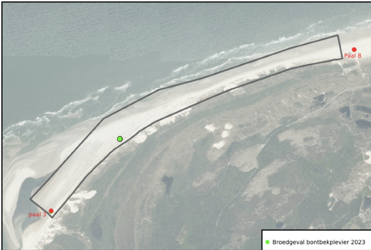
Afb.3: Broedgeval bontbekplevier op strand tussen paal 8 en paal 3.