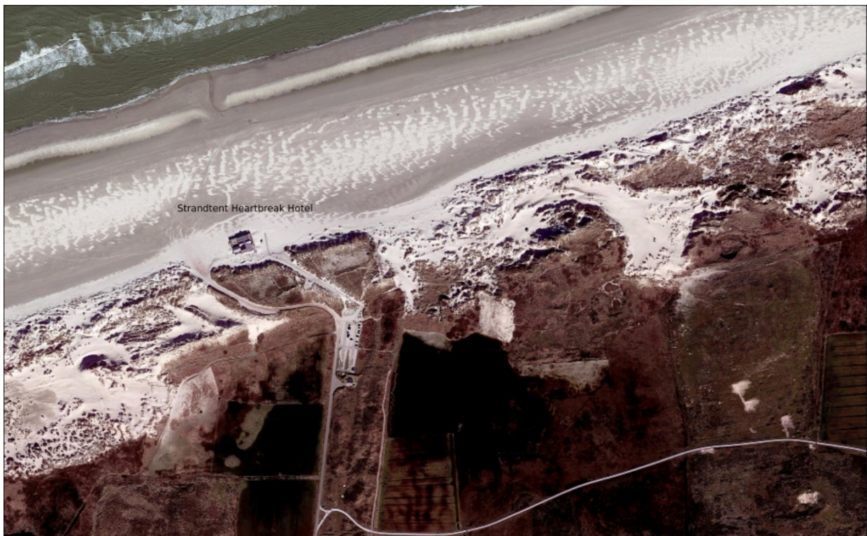
Afb.7: Strandopgang bij paal 18 einde badweg Oosterend. Op dit intensief gebruikte stuk strand zijn geen bezwaren op het te water laten van een boot met auto en aanhangwagen tussen paal 17 en 19.