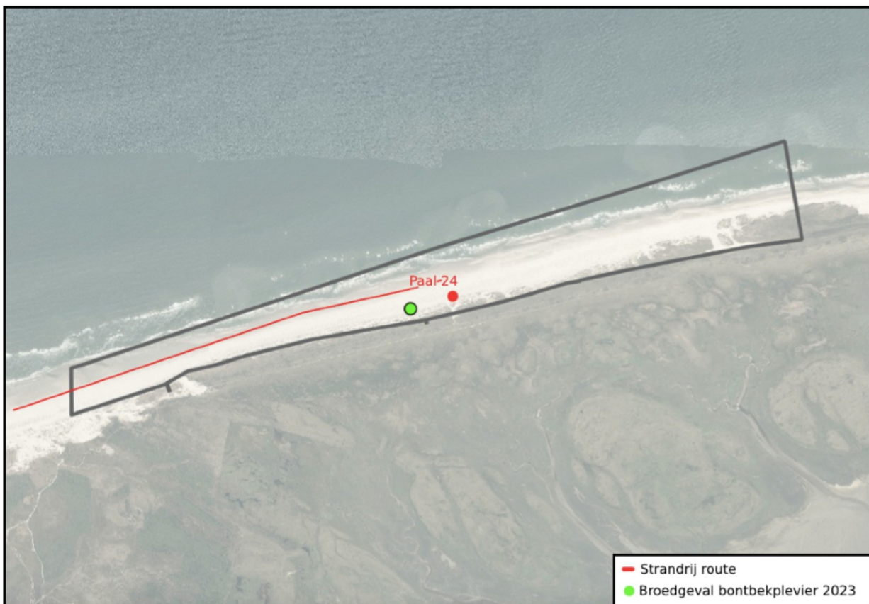
Afb.4: Broedgeval bontbekplevier op strand tussen paal 18 en paal 24.