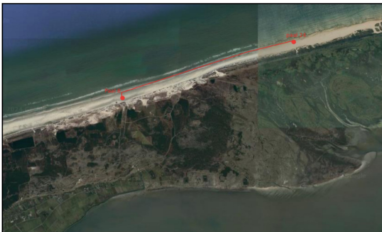
Afb.2: Ligging van het voorgenomen te berijden strand van paal 18 t/m paal 24.