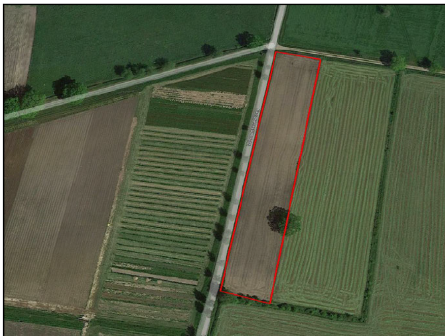
Figuur 1: Locatie perceel westelijk van zonnepark.