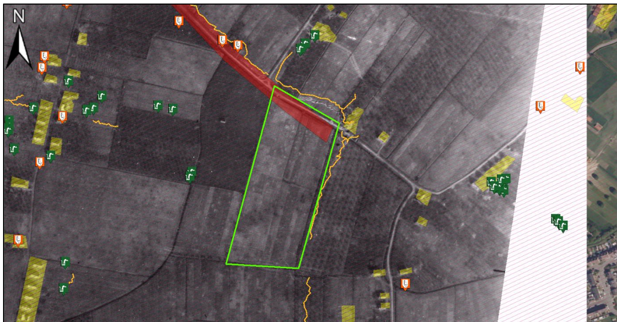
Figuur 3. Alle indicaties binnen- en in de directe nabijheid van het projectgebied te Gendt. Het gehele projectgebied is getroffen door artillerie- en mortierbeschietingen. Tevens waren er aan de rand van het projectgebied loopgraven en een mijnenveld aanwezig. In de wijdere omgeving is er sprake van de aanwezigheid van beschadigde bebouwing en schuttersputten. In het verleden zijn in deze omgeving door de EODD verschillende ruiming uitgevoerd. Luchtfoto 15 maart 1945, luchtfotonummer 4081.

Uit de luchtfotoanalyse voor de risicokaart is gebleken dat het gehele grondgebied van de gemeente Lingewaard kan worden beschouwd als zijnde getroffen door artillerie- en/of mortierbeschietingen. Zie onderstaande afbeeldingen voor een overzicht van alle in de risicokaart vastgestelde indicaties en verdachte gebieden binnen en in de directe nabijheid van het projectgebied te Gendt.