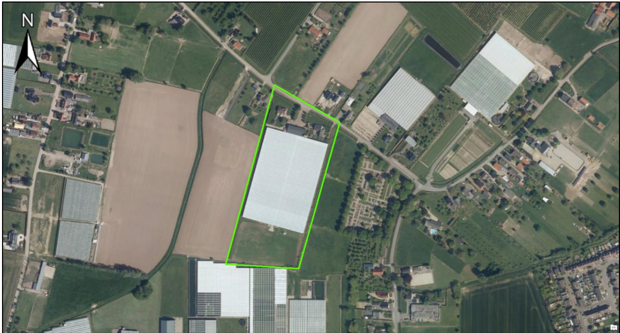
Figuur 1. Het projectgebied (groen omlijnd) aan de Zandvoortsestraat te Gendt.

Uit de projectie van het projectgebied op de risicokaart is gebleken dat zich hier tijdens de Tweede Wereldoorlog diverse oorlogshandelingen hebben afgespeeld waarbij mogelijk OO in de bodem zijn achtergebleven. Zo is binnen het projectgebied en/of in de directe omgeving daarvan sprake van de aanwezigheid van: