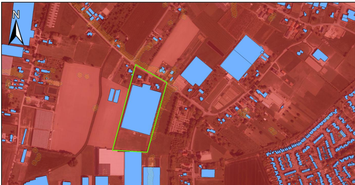
Figuur 4. De op basis van de verschillende indicaties vastgestelde verdachte gebieden. Binnen het gehele projectgebied (groen omlijnd) en in de (directe) omgeving is sprake van een verdacht gebied verschoten geschutmunitie. Verder is er aan de rand van het projectgebied sprake van een gebied verdacht op klein-kalibermunitie, handgranaten, geweergrenaten en munitie voor granaatwerpers. Een gedeelte van het projectgebied is reeds geroerd door de bouw van huizen en een kas.