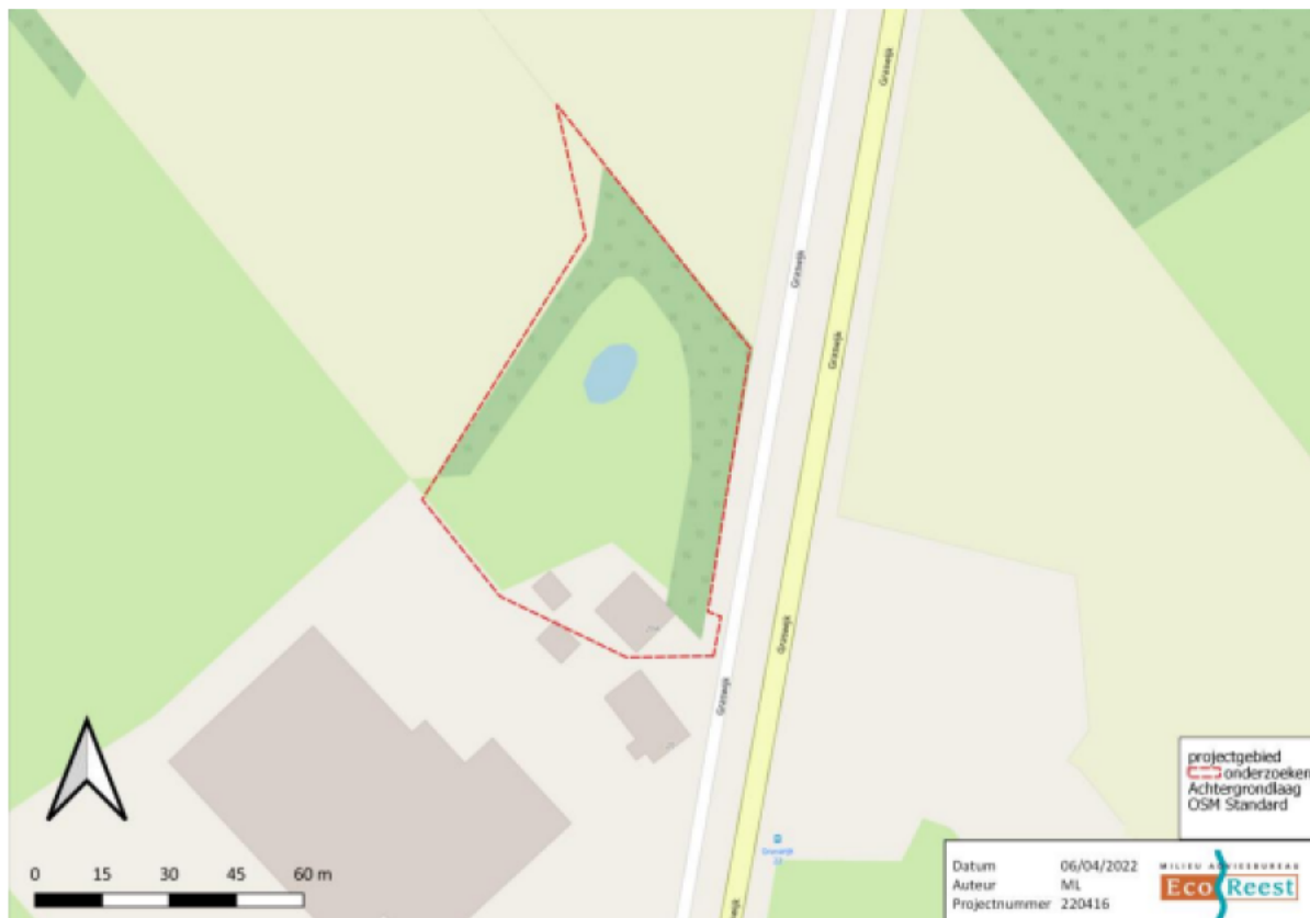
Figuur 1: Plangebied rood omlijnd (bron: Activiteitenplan)

Op 7 november 2023 hebben wij een aanvraag ontvangen voor een ontheffing van de Wnb van Eco Reest Holding B.V. namens Gemeente Assen (hierna ontheffinghouder). De aanvraag heeft betrekking op de sloop van een woning, gelegen aan Graswijk 20a in Assen in de gemeente Assen. De ontheffinghouder heeft ontheffing aangevraagd voor de verbodsbepalingen genoemd in artikel 3.5 lid 2 en 4 van de Wnb voor de gewone dwergvleermuis ( Pipistrellus pipistrellus ).