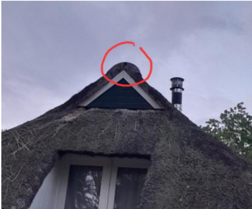
Figuur 2: invliegopening in het rieten dak via een klein gat in de nok

De zomerverblijfplaats biedt in de winter geen goede gebufferde, vorstvrije plek, waardoor uitgesloten wordt dat deze verblijfplaats ook als winterverblijfplaats wordt gebruikt.