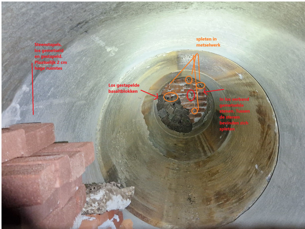
Figuur 5. Gerealiseerde alternatieve winterverblijfplaats.