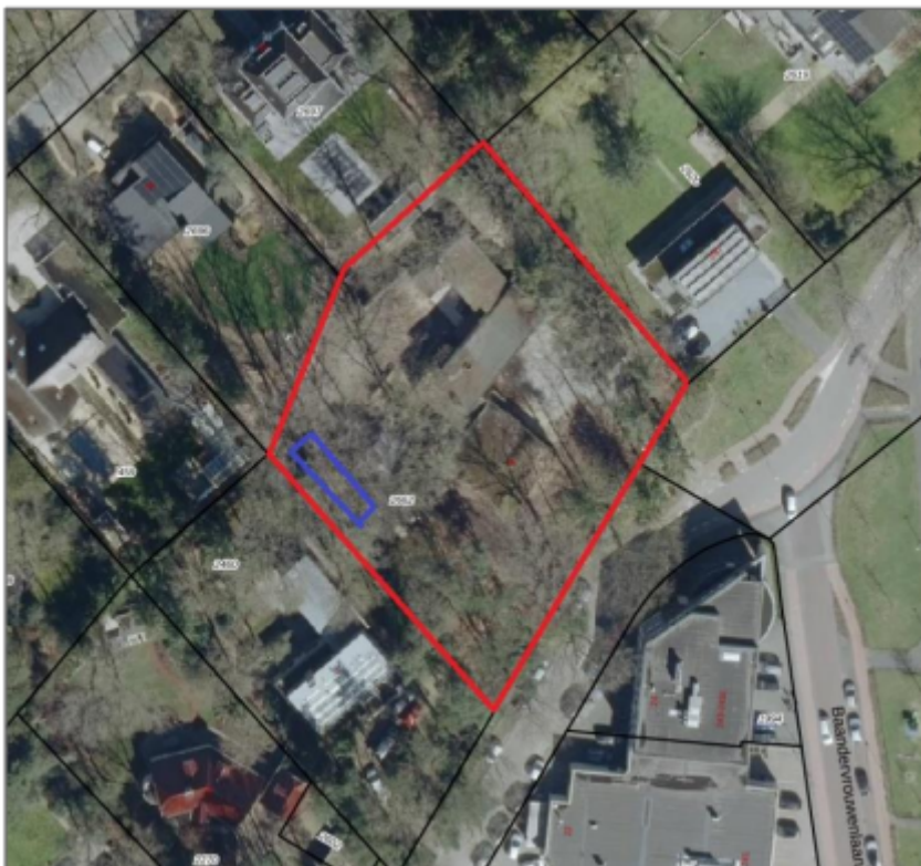
Figuur 3. Globale locatie van het alternatieve winterverblijf.