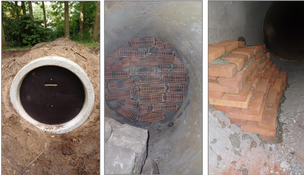
Figuur 4. Gerealiseerde alternatieve winterverblijfplaats.