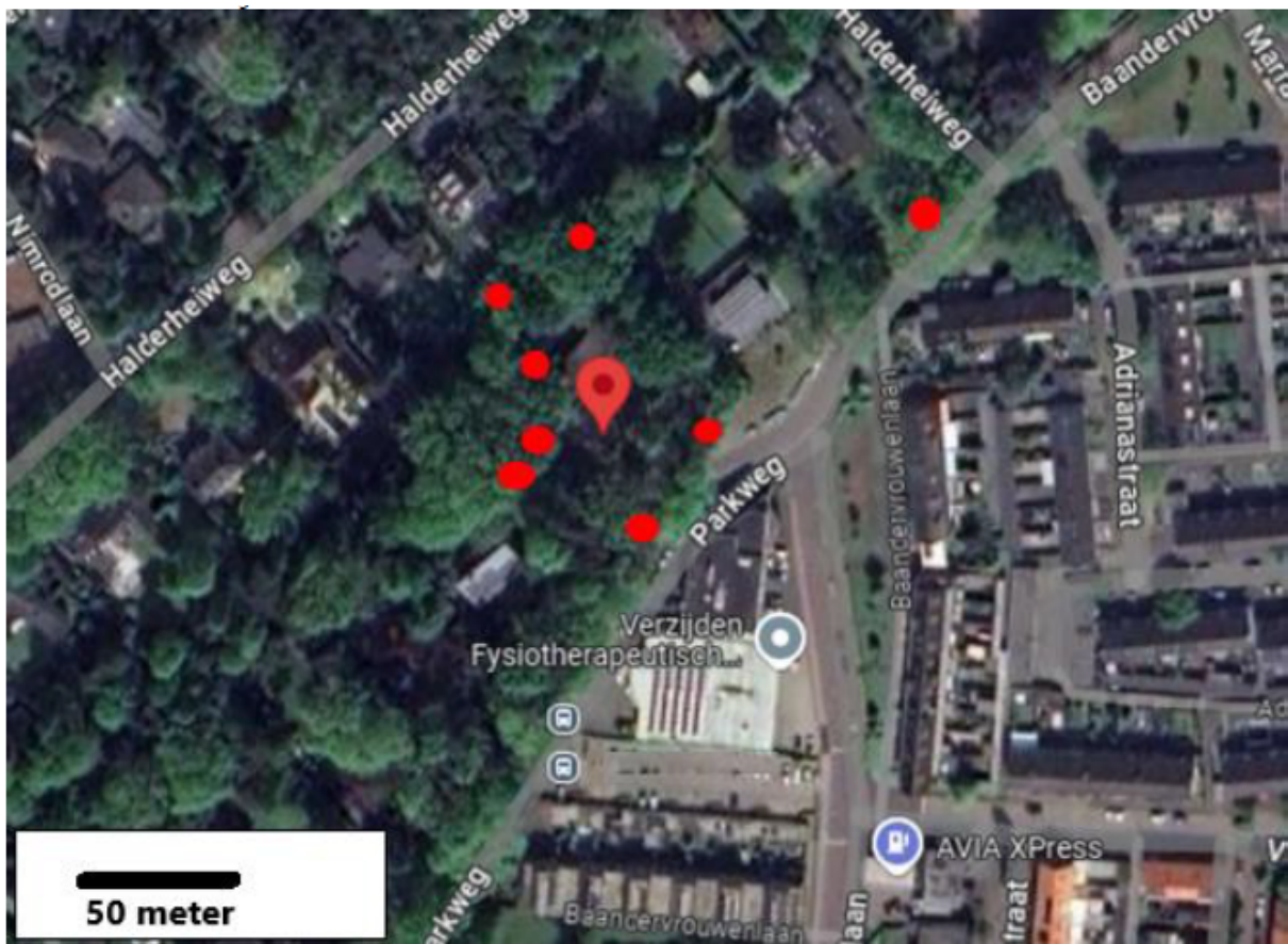
Figuur 2. Locatie van de tijdelijke vleermuiskasten aan bomen.