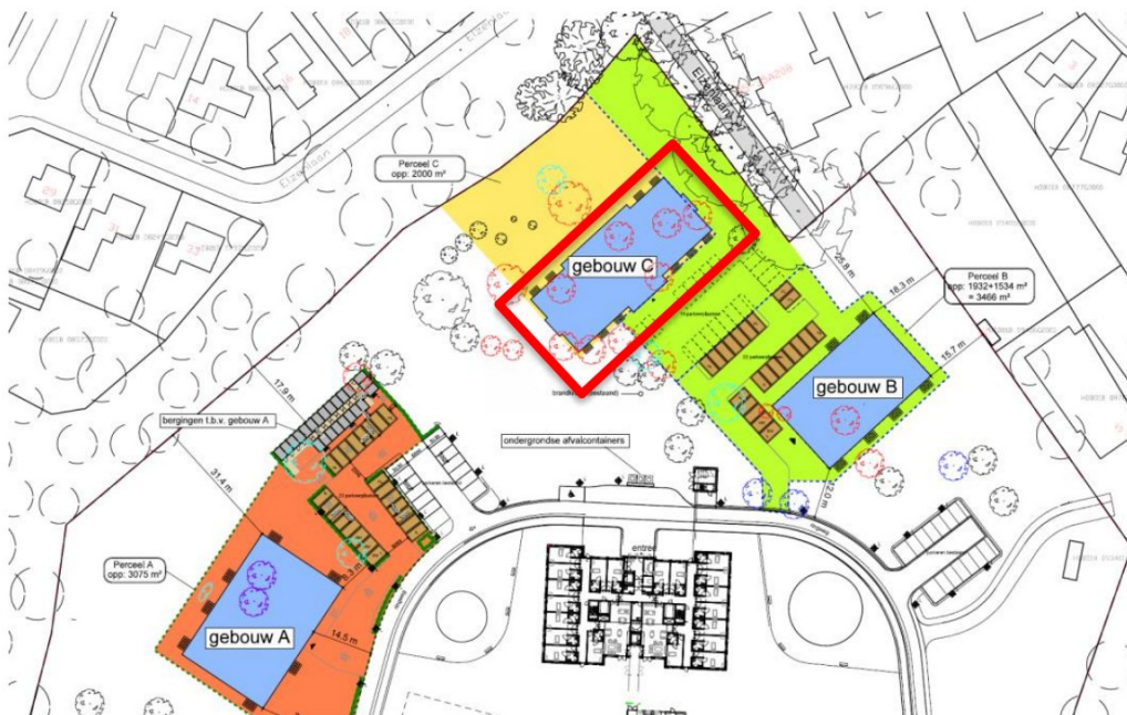
Situatie met aanduiding Gebouw C

Gebouw C maakt onderdeel uit van drie te realiseren appartementengebouwen op het terrein van Stichting Saxenburgh aan de Rheezerweg 73 in Hardenberg. Op onderstaande situatie is Gebouw C weergegeven waar deze memo betrekking op heeft. De andere twee gebouwen zijn reguliere woonfuncties.