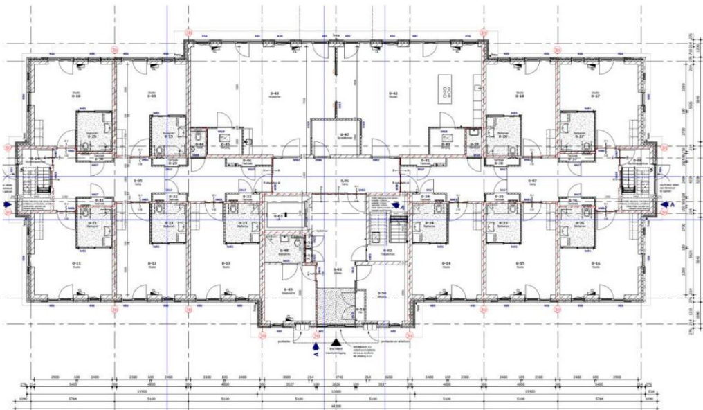
Overzicht begane grond

Koken vindt gezamenlijk en onder begeleiding plaats in de gemeenschappelijke keuken. Verder bevindt zich op iedere bouwlaag een gemeenschappelijke huiskamer waar de cliënten kunnen verblijven. Bereiding van warmwater in de gemeenschappelijke keukens vindt plaats door een individuele elektrische boiler per gemeenschappelijke keuken.