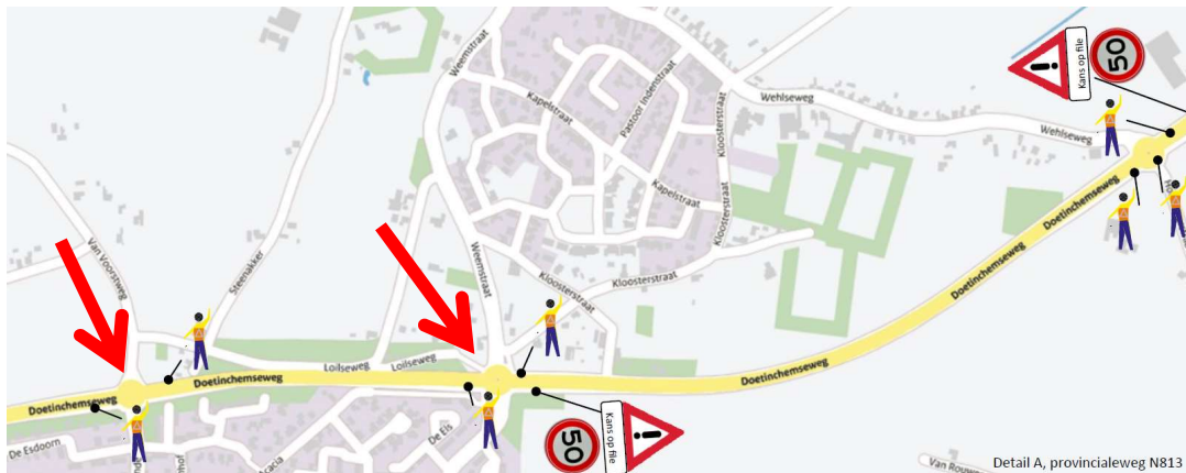
Figuur 2: twee maal overstek Provincialeweg N813 (rode pijlen)

Gedurende de optocht wordt twee maal de provinciale weg overgestoken (zie rode pijlen in figuur 2). In overleg met de Politie wordt het verkeer door verkeersregelaars stil gezet en het verkeer en de deelnemers van de optocht worden in blokken doorgelaten.