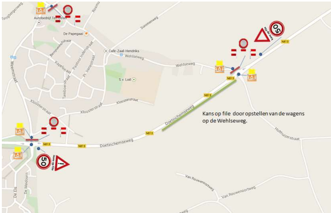
Figuur 1: tijdelijke snelheidsbeperking Provincialeweg N813