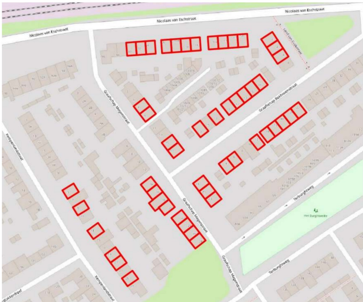
Figuur 1. Overzichtskarta van het plangebied. De werkzaamheden vinden plaats aan de rood omkaderde woningen.

Dit document is digitaal ondertekend en bevat daardoor geen handtekening.