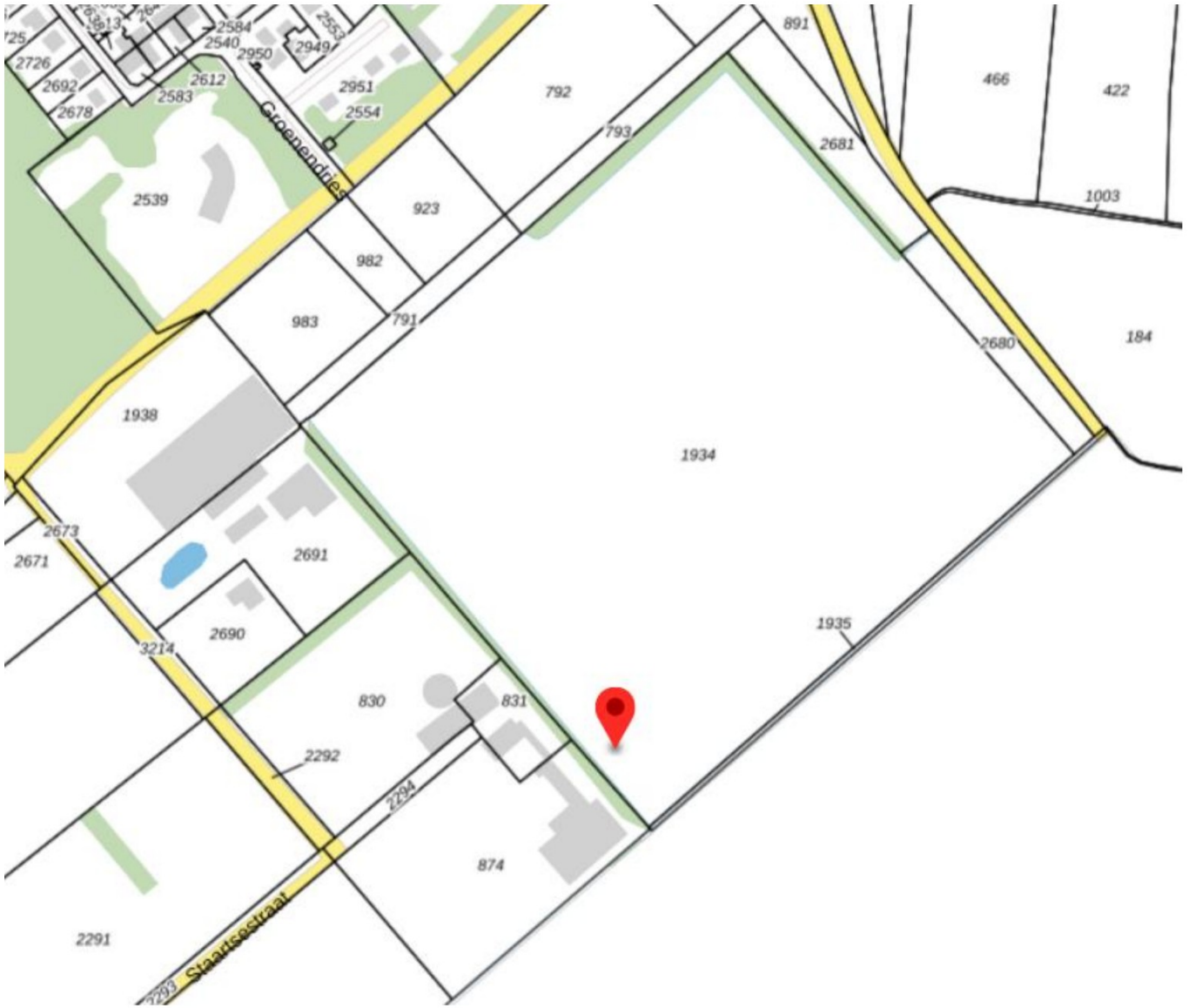
Figuur 1: kadastrale percelen rondom initiatief locatie