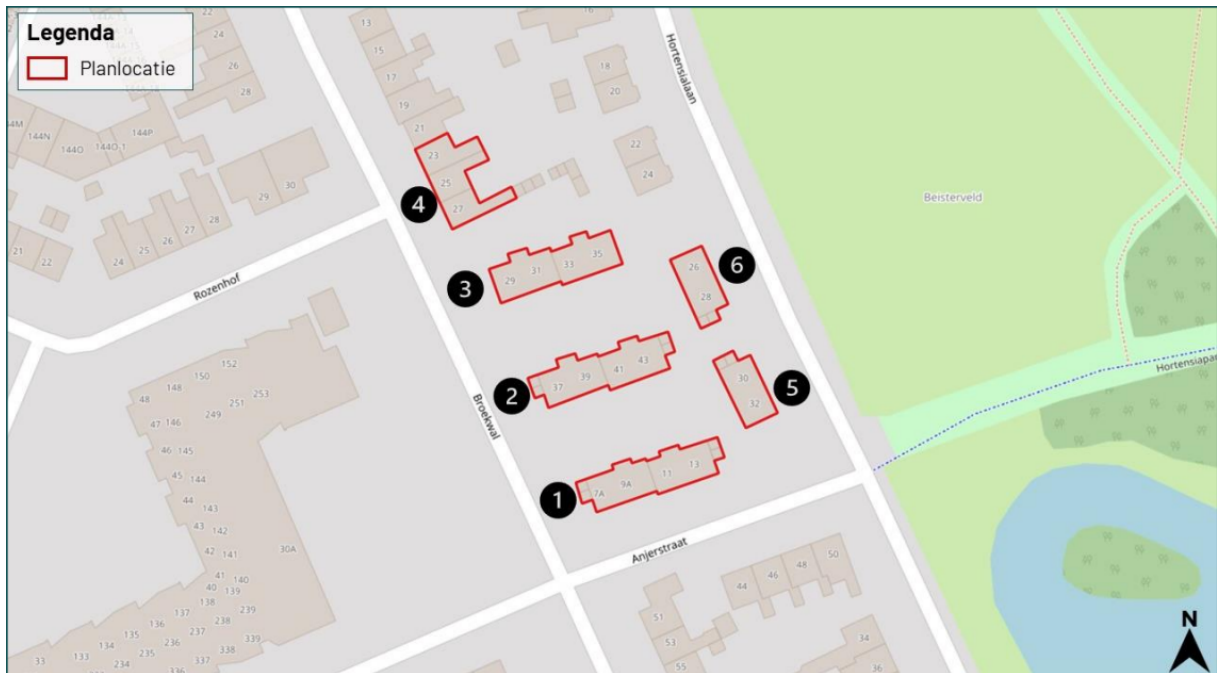
Figuur 1. Locatie aan de Anjerstraat en Broekwal te Helmond. De activiteiten vinden plaats binnen de omliggende bebouwing.