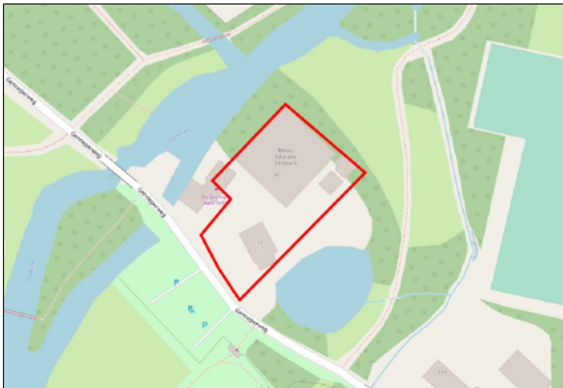
Figuur 1. Locatie aan de Genneperweg 145-147 te Eindhoven. De activiteiten vinden plaats binnen het omliggende gebied.