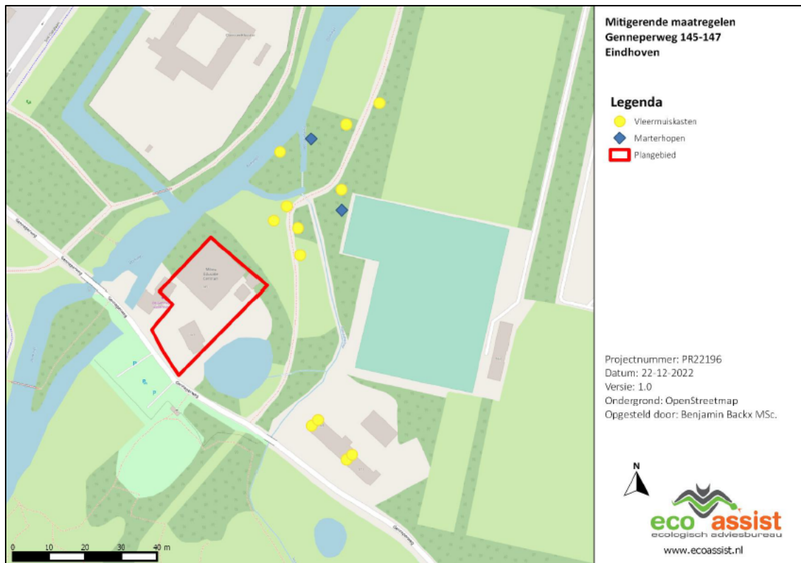
Figuur 3. Locatie van de tijdelijke voorzieningen.