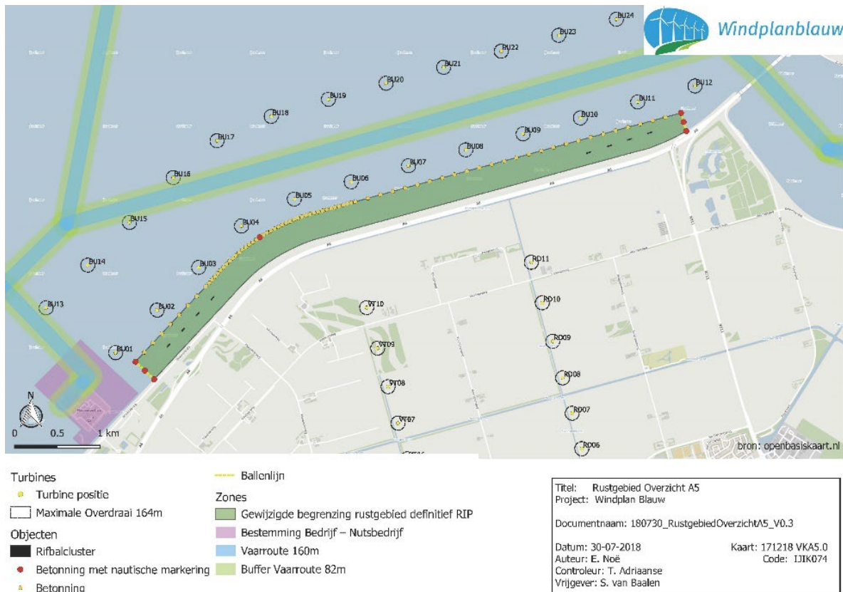
Figuur 2-1 Futenrustgebied (donkergroen)