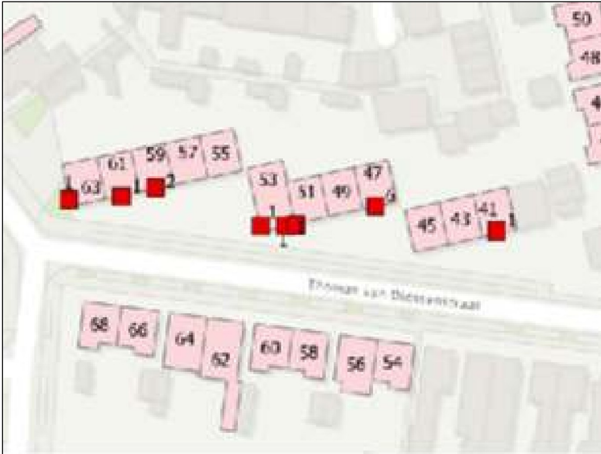
Figuur 2. Overzichtskaart van de aangetroffen huismusnesten binnen het plangebied.