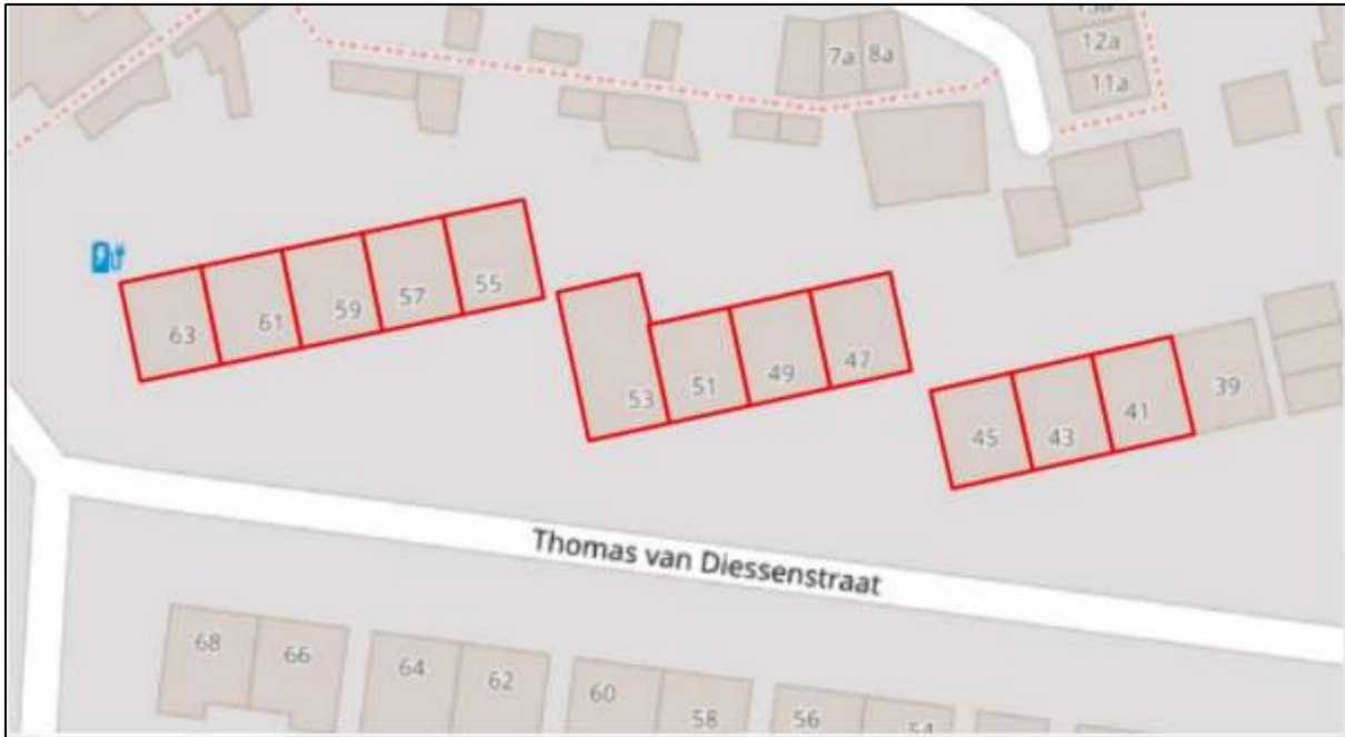
Figuur 1. Overzichtskaart van het plangebied. De werkzaamheden vinden plaats aan de rood omkaderde woningen.