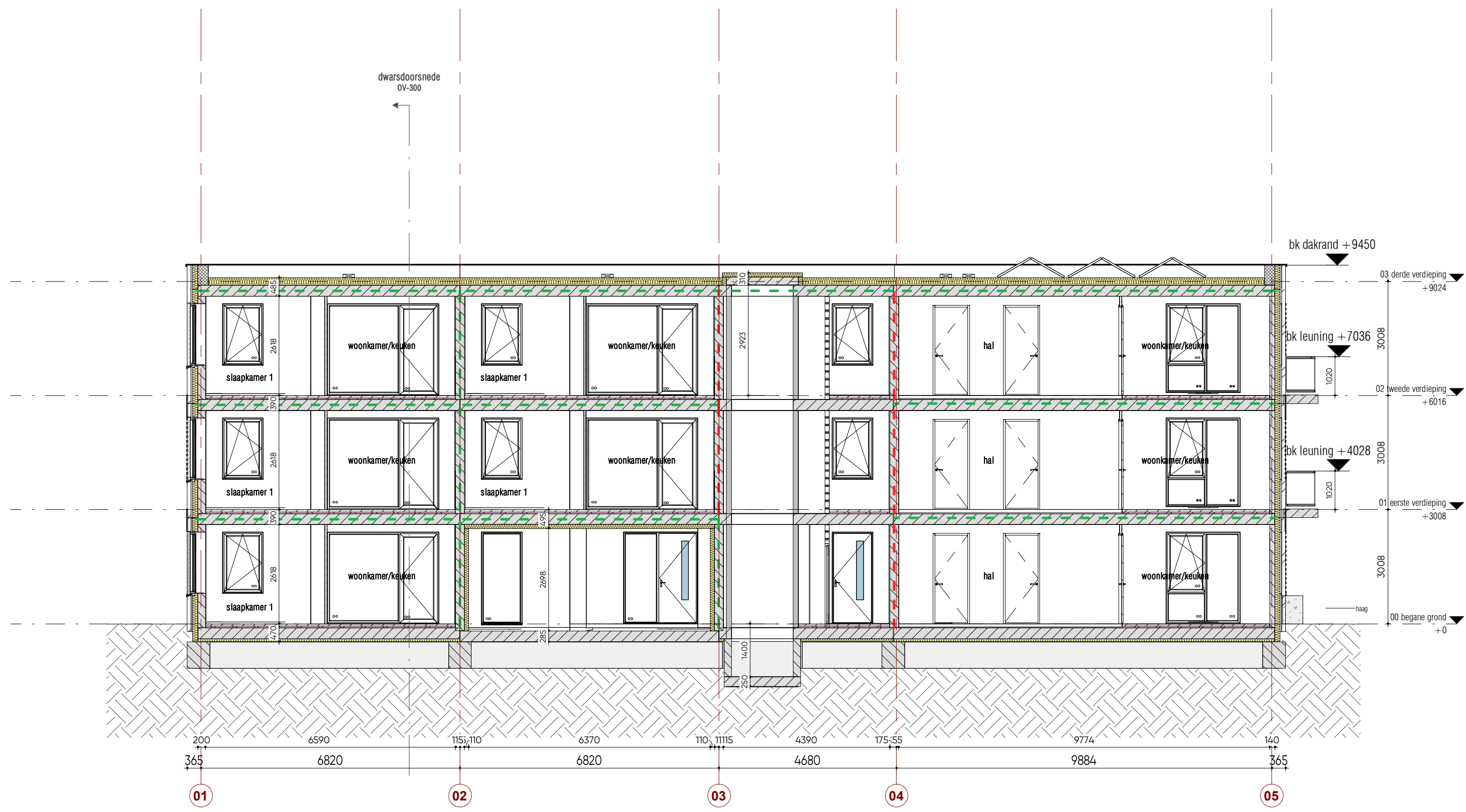
langsdoorsnede_lifschacht 1 : 100