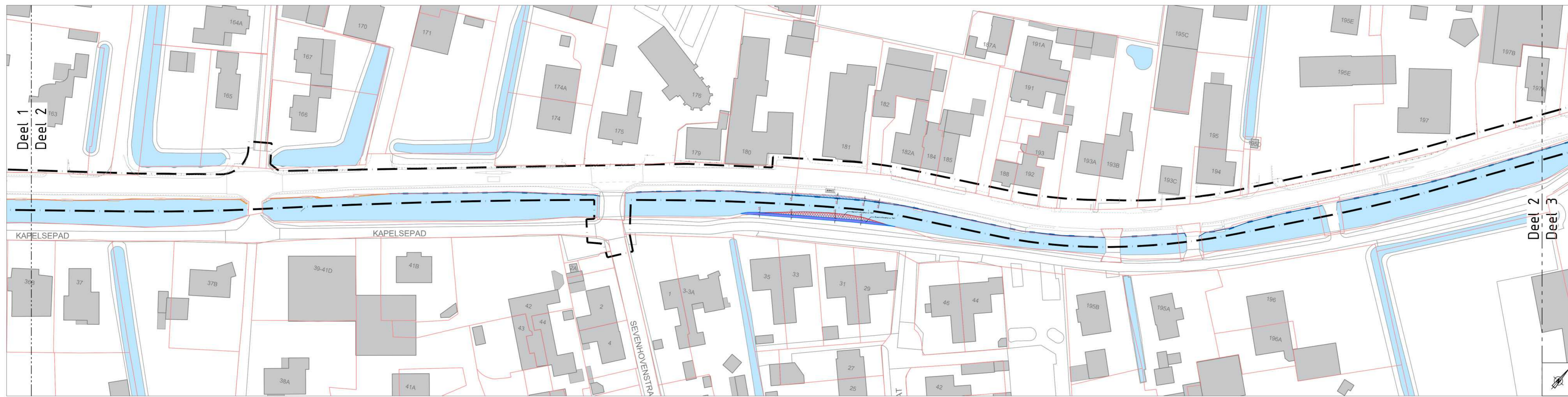
DEEL 2 SCHAAL 1500