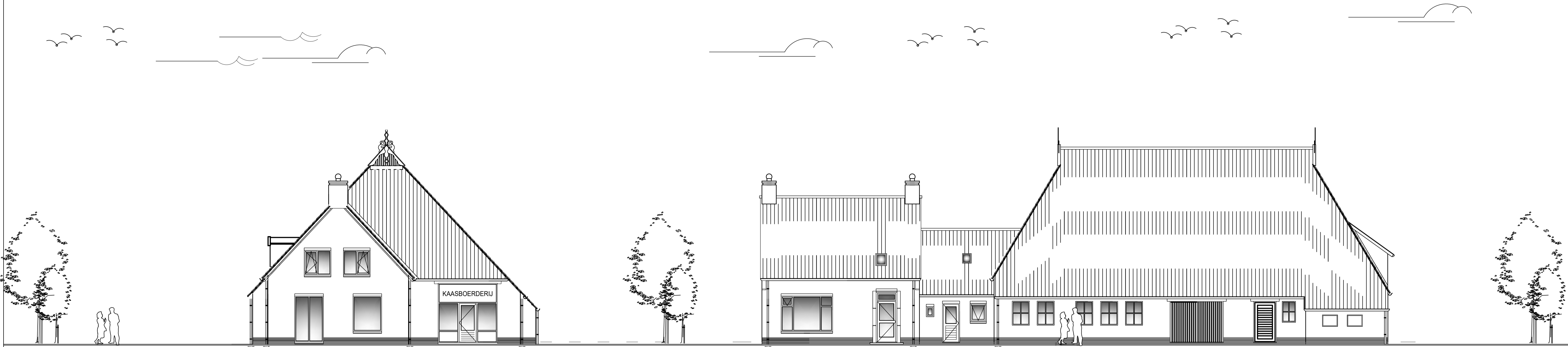
Voorgevel Bestaande situatie Schaal 1:100 Zuidgevel