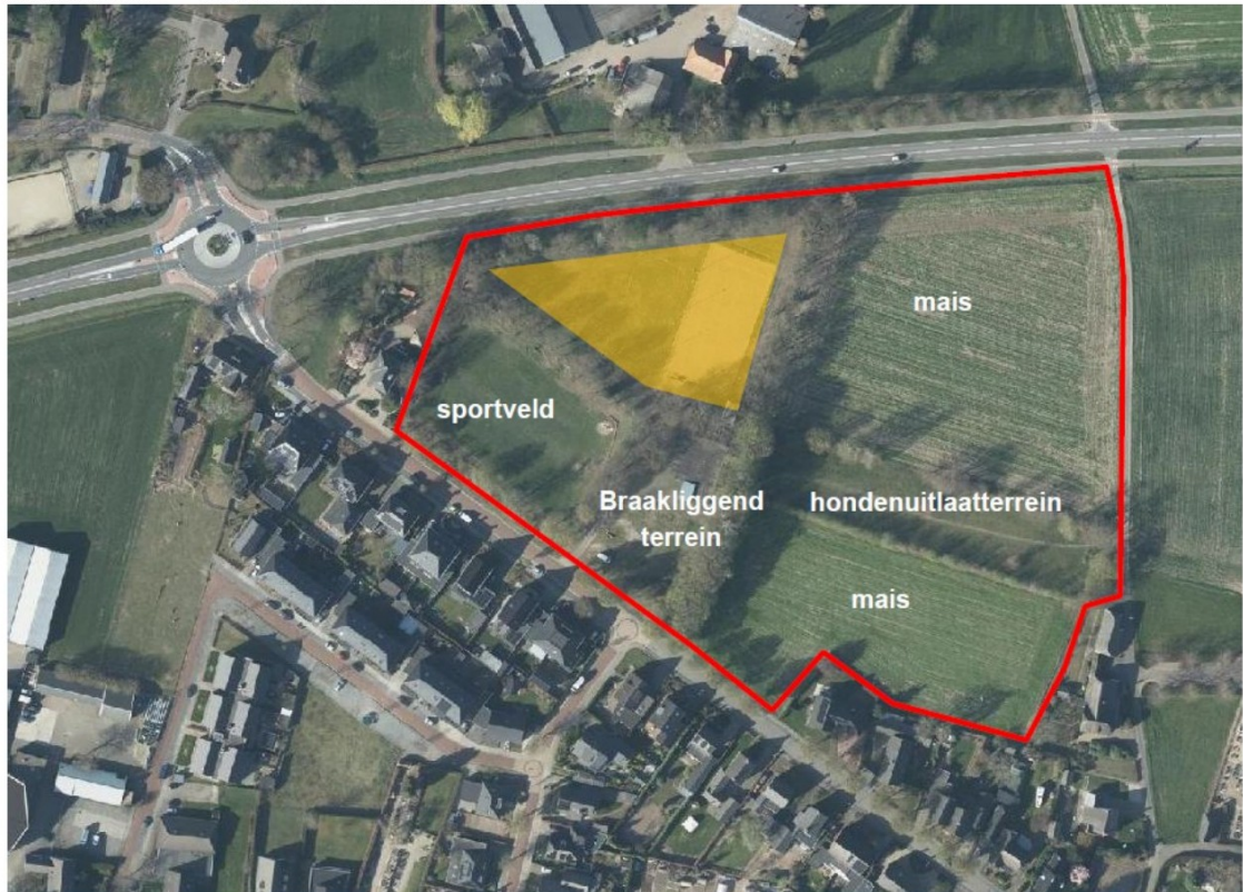
Figuur 1: Plangebied Fokkenkamp te Wehl