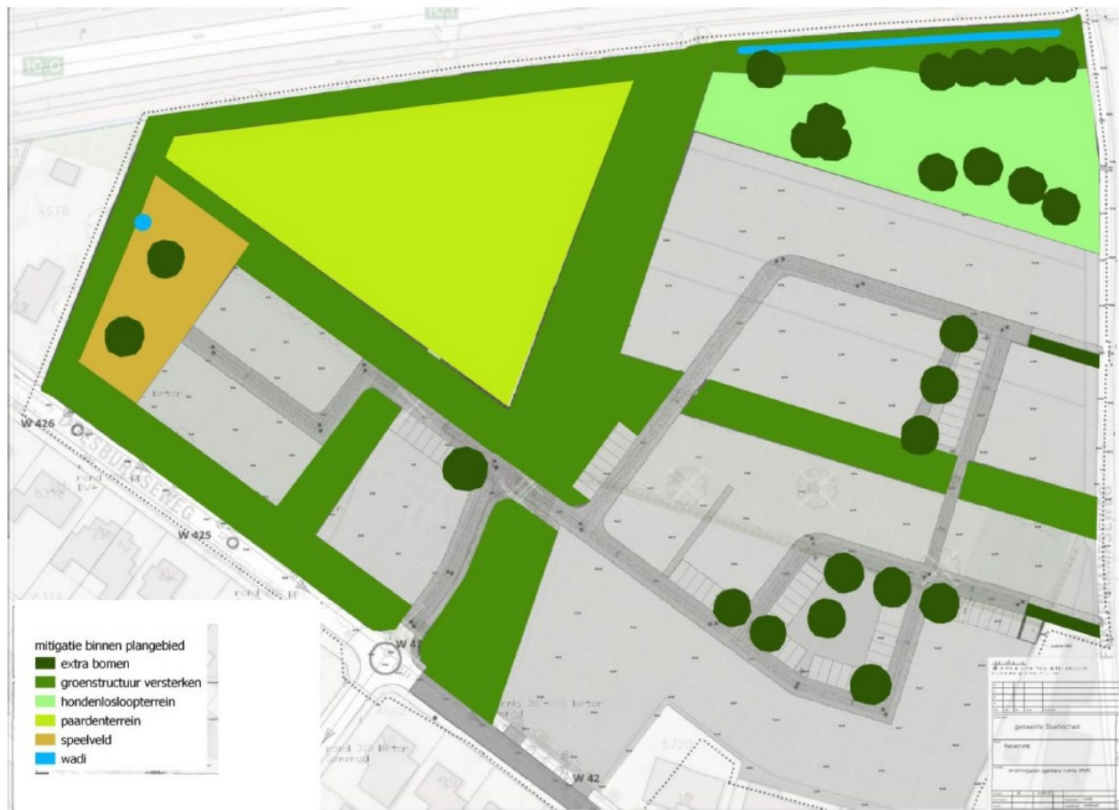
Figuur 2: Versterking groenstructuren en aanplant nieuwe bomen.