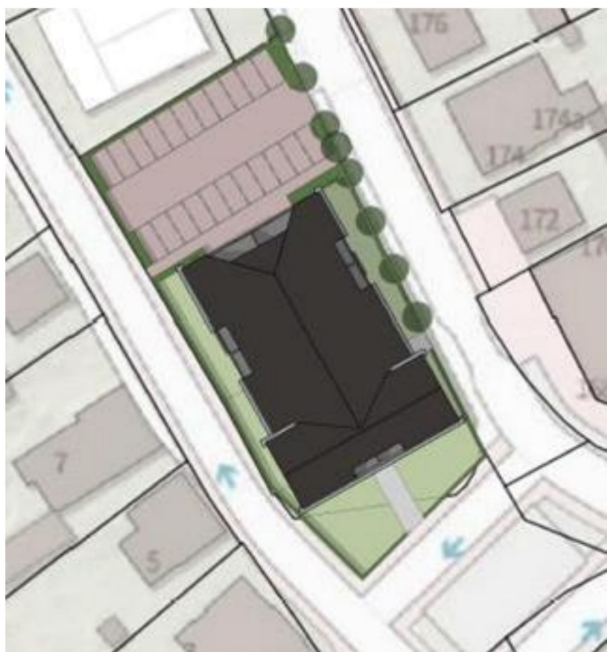
Figuur 2.1. Schets van een mogelijke toekomstige invulling.

De bebouwing in het plangebied wordt gesloopt waarna er nieuwe woningen worden gerealiseerd. De aanwezige verhardingen en vegetaties worden verwijderd, bomen worden waar mogelijk behouden. Figuur 2.1 geeft een overzicht van de toekomstige situatie.