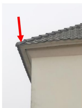
Figuur 3.2. Locatie huismussennest (blauwe pijl).