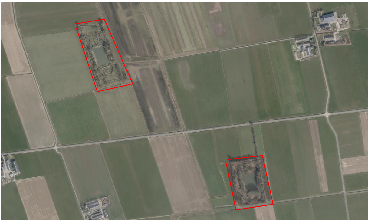
Luchtfoto 1: voorbeeld van een eendenkooi in het landschap (rood omrand). Een eendenkooi bestaat uit een plas met sloten en daaromheen bos of struiken. Dit betreft de Marensse kooi en Kesselse kooi. Beide gelegen aan de Burgemeester Smitsweg te Maren-Kessel.

Rode ster: actieve eendenkooi. Blauwe ster: voormalig kooirelict waar een vrijwilligersgroep actief is of waar de activiteiten onbekend zijn. Oranje ster: onbekend welke activiteiten momenteel lopen.