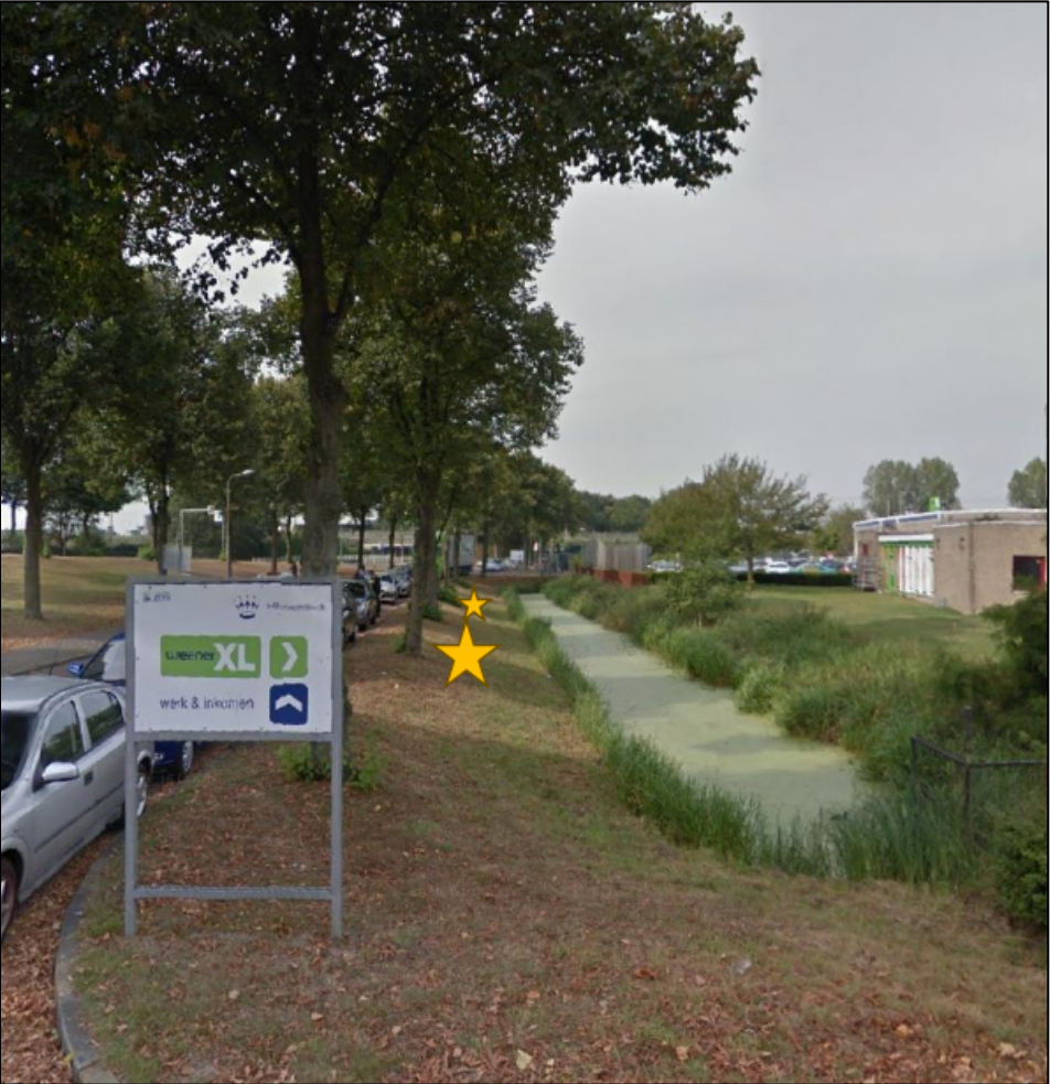
Figuur 2. Locaties van de tijdelijke voorzieningen; de gele sterren geven de locaties weer van rocketboxen.