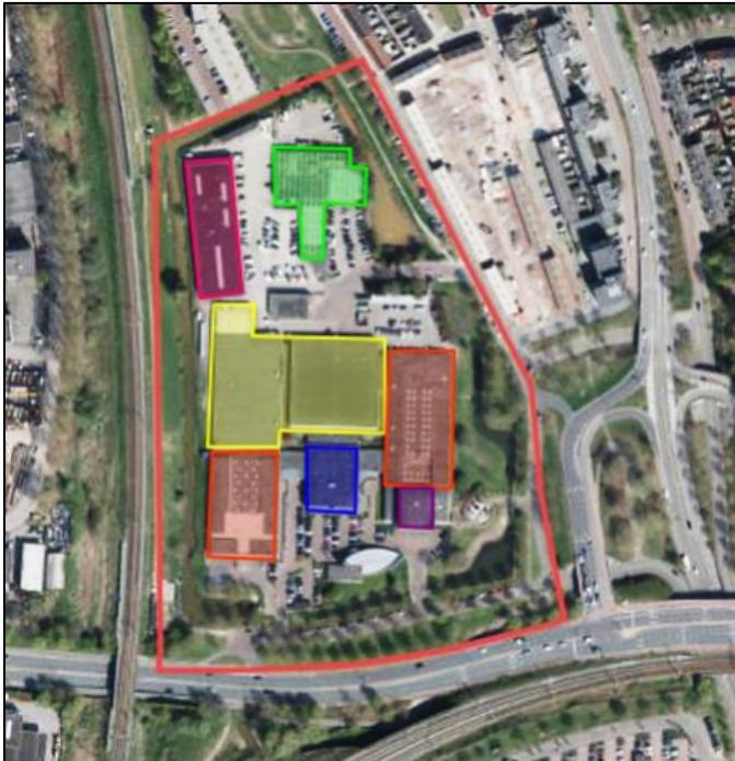
Figuur 1. Locatie van het Weener XL gebouwencomplex. De geel en rood gekleurde vlakken zijn de bedrijfshallen van het hoofdgebouw. Het blauwe vlak is de kantine en het paarse vlak is een kantoorblok boven de hoofdingang. Achter het hoofdgebouw zijn nog een garage (roze) en een glazen kas die gebruikt werd als fietsenstalling (groen). De activiteiten vinden plaats binnen het rood-omlijnde gebied.