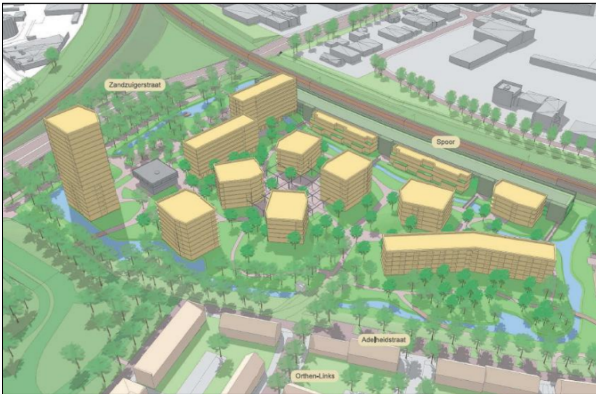
Figuur 3. Impressie van de nieuwe woonwijk, waar de permanente voorzieningen worden gerealiseerd. Locaties zijn nog onbekend en worden in een later stadium uitgewerkt.