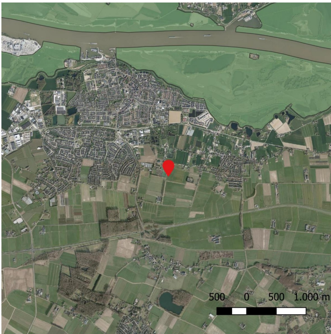
Figuur 5 Projectlocatie t.a.v. Natura 2000 'Rijntakken' (Janssen) (PDOK, 2023)

Wel is er mogelijk sprake van een te grote depositie van stikstof welke tot verzuring leidt van bepaalde habitattypen. In het Natura 2000 gebied Rijntakken is er sprake van diverse habitattypen welke gevoelig zijn voor genoemde depositie.