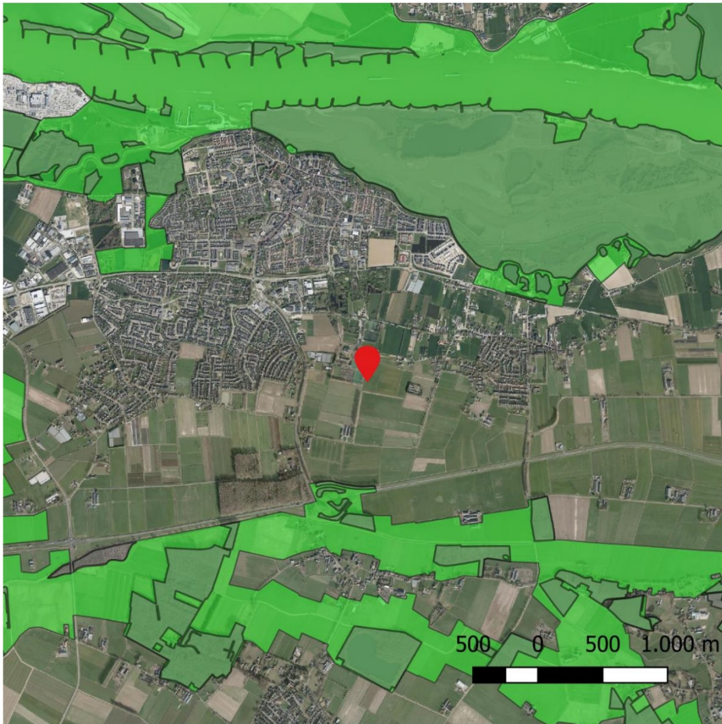
Figuur 4 Projectlocatie t.a.v. Gelders Natuurnetwerk (Janssen) (PDOK, 2023)

De gebiedsbescherming van het Gelders natuurnetwerk erkent geen externe werking, doordat het project buiten het gebied valt leiden de activiteiten niet tot consequenties voor het provinciaal beleid.