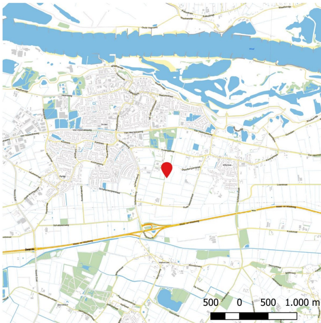
Figuur 1 De projectlocatie (Janssen) (PDOK, 2023)

De projectlocatie bevindt zich op het sportcomplex de Gelenberg. De Gelenberg is omsloten door de Koningstraat, Scharenburg en Oude Weisestraat. Het sportcomplex is vrijwel geheel omsloten door landbouwgebied. Aan de noordzijde is er een kleine overgang naar het Drutens bos. Er is rondom geen sprake van veilige passages voor fauna. Het Drutens bos is een gebied waar veel wilgen en populieren groeien, dit gebied ligt rondom oude tichelgaten en hier is sprake van ontoegankelijke zones c.q. rustgebieden.