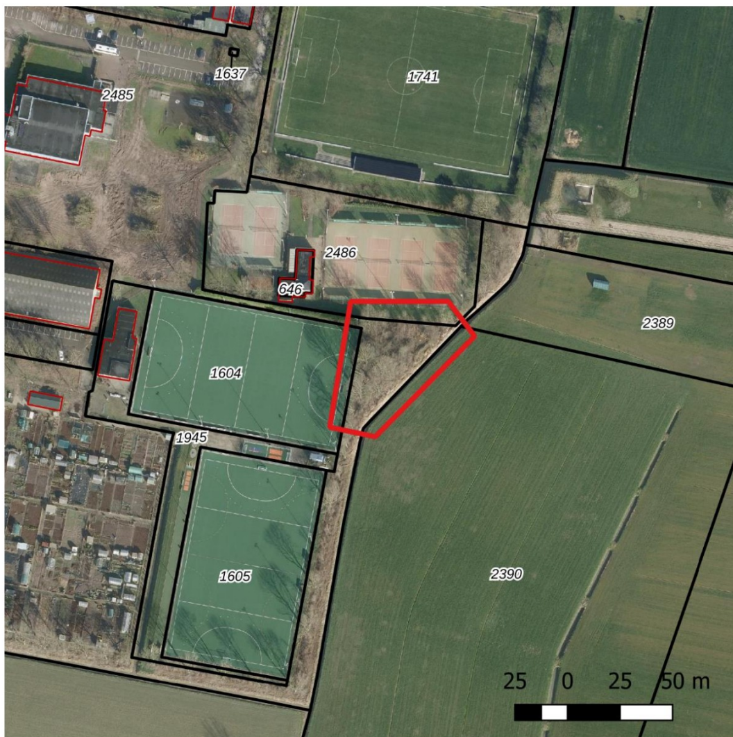
Figuur 2 het werkgebied (rode lijnen) van het onderzoek (Janssen) (PDOK, 2023)

Het gebied bestaat uit bosplantsoenen met aan de zuidoostzijde een watergang, deze watergang betreft een klasse B-watergang. Het bosplantsoen wordt extensief onderhouden, er is sprake van liggend kreupelhout en een dikke strooisellaag.