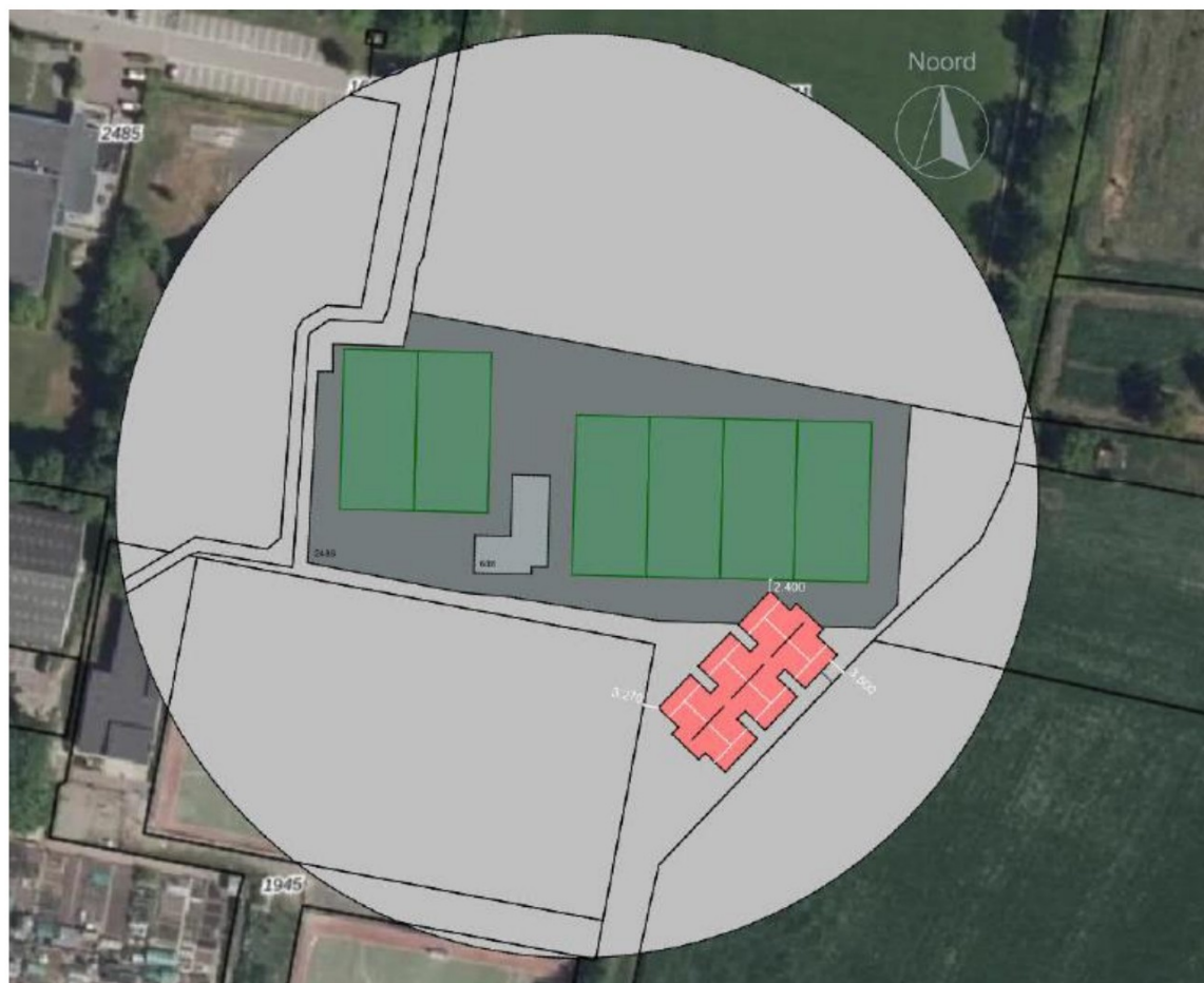
Figuur 3 De gewenste situatie, drie padelbanen met de gewenste afmetingen (Gelenberg)

Indien dit het geval is wordt de lijnvormige groenstructuur waar dit gedeelte bosplantsoen onderdeel van is doorbroken.