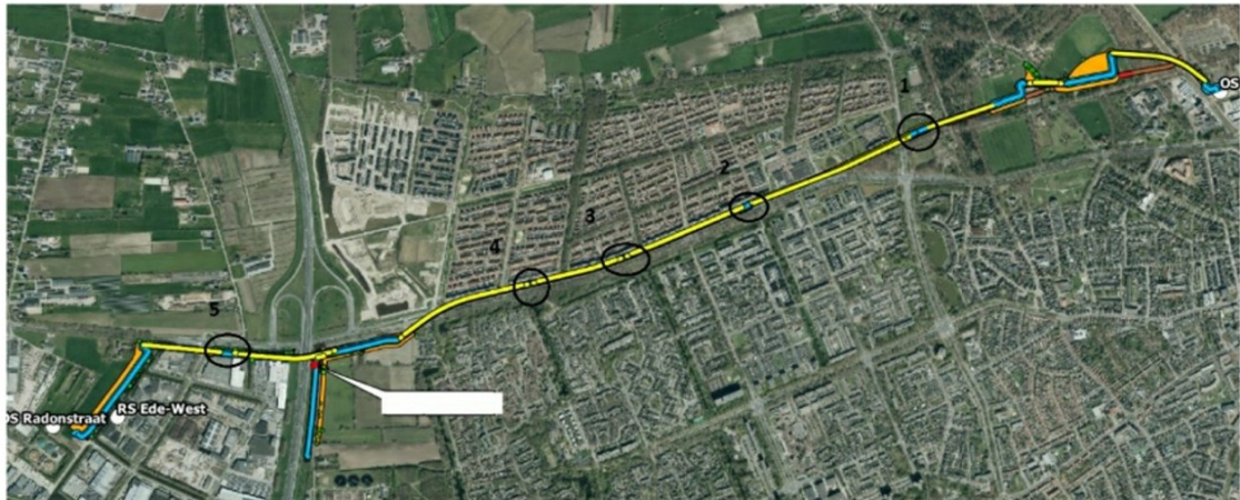
Figuur 2: Globaal overzicht van de gerealiseerde kap met de 4 kaplocaties, die in figuur 1 zijn aangegeven. De meest oostelijke cirkel is niet meegenomen in de onderhavige aanvraag.