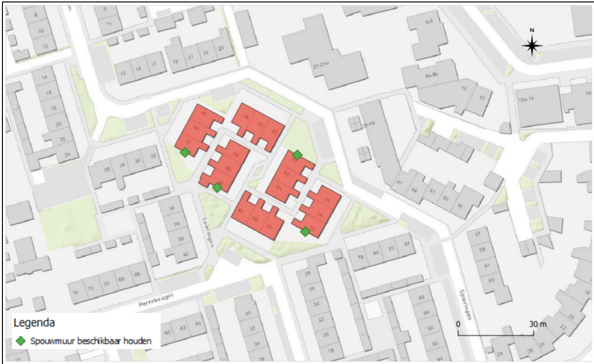
Figuur 4. Locatie van de permanente voorzieningen voor de laatvlieger.