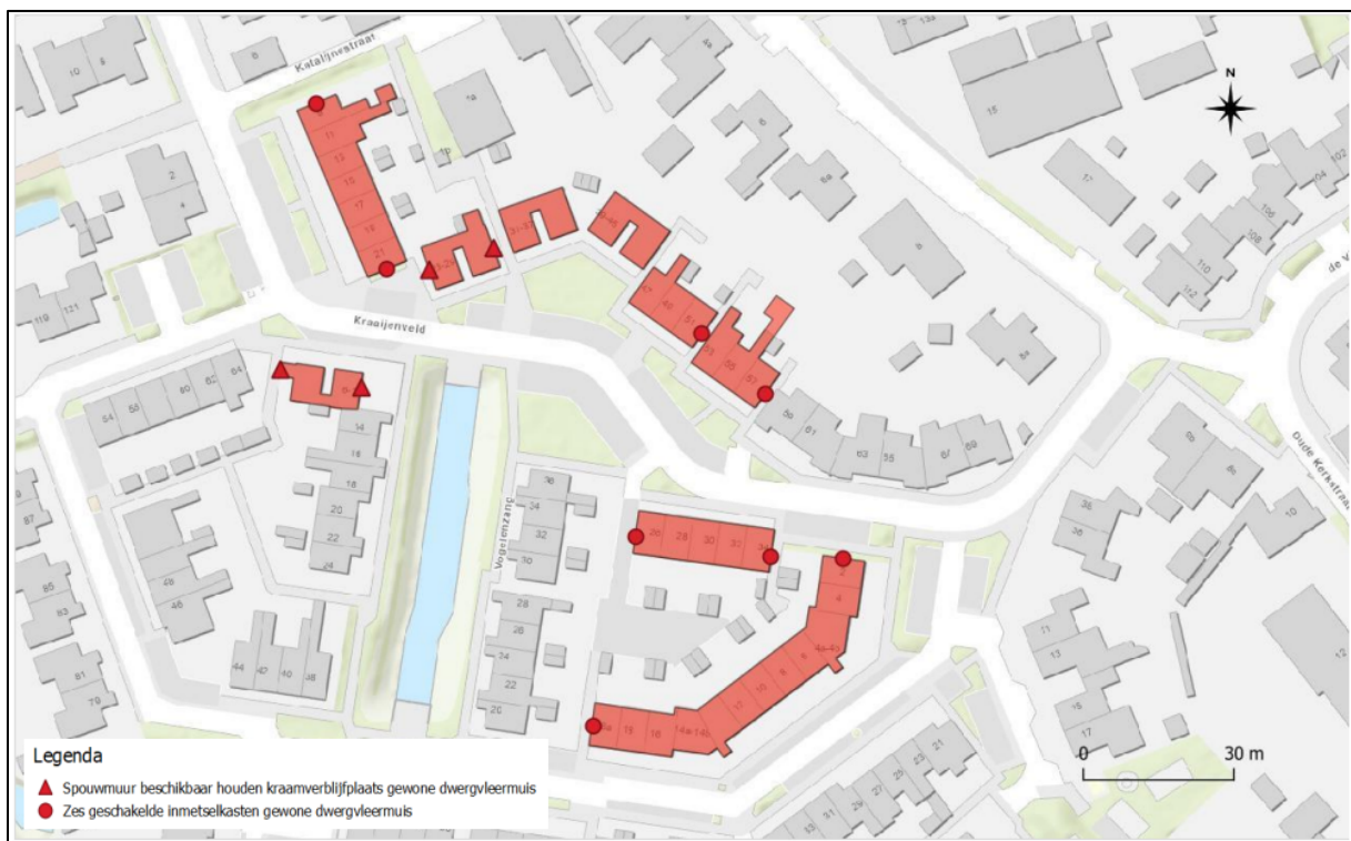
Figuur 3. Locatie van de permanente voorzieningen voor de gewone dwergvleermuis.