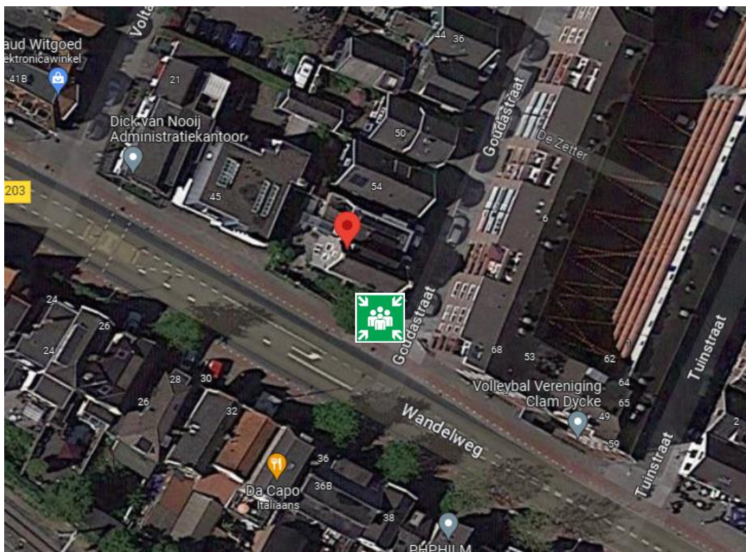
Situatiefoto: Goudastraat 58 met verzamelplaats