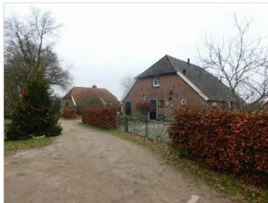
Figuur 6 Woningen in Bronkhorst met wolfsdaken.