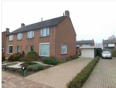
Figuur 3 Woningen aan de Russerweg in Toldijk die geschikt zijn als alternatieve verblijfplaats voor laatvliegers.