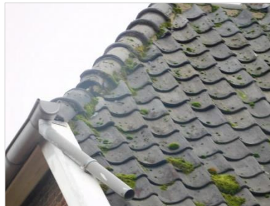
Figuur 7 Voldoende ruimte onder dakpannen en bij enkele kapotte nokvorsten.