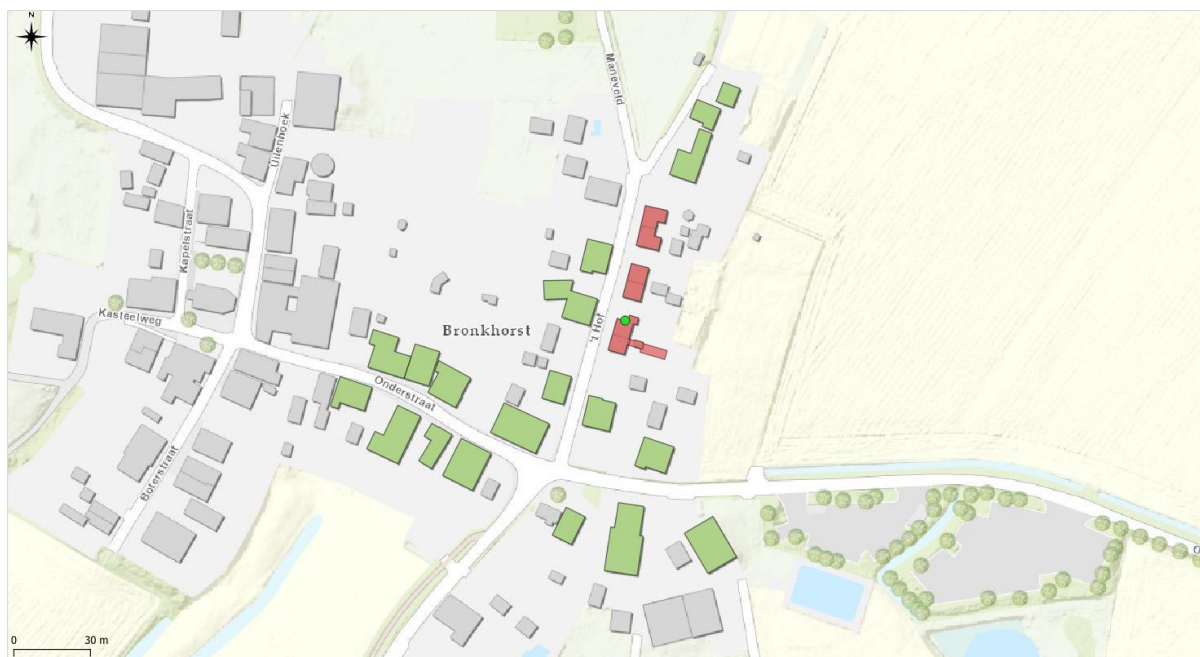
Figuur 1 Woningen die potentieel geschikt (groen) zijn als alternatieve zomerverblijfplaats in de buurt van het aangetroffen verblijf in Bronkhorst.

Het zomerverblijf van de laatvlieger is aangetroffen onder de overhangende kantpannen van de woning aan 't Hof 8. De alternatieve verblijfplaatsen dienen binnen een straal van 200 meter van de huidige zomerverblijven beschikbaar te zijn. In de omgeving is voldoende alternatief aanwezig, waar laatvliegers een zomerverblijf kunnen hebben (zie figuur 1). De woningen in Bronkhorst zijn veelal oude woningen met een wolfsdak, waarbij de dakpannen niet meer strak op de pannenlatten aansluiten. Hierdoor ontstaan er bij diverse plekken bij het dak voldoende ruimte waar laatvliegers onder kunnen kruipen. Laatvliegers staan bekend om het gebruik van bovenstaande beschreven locaties, hiermee zijn de alternatieven mogelijkheden op voorhand geschikt bevonden als tijdelijk alternatief.