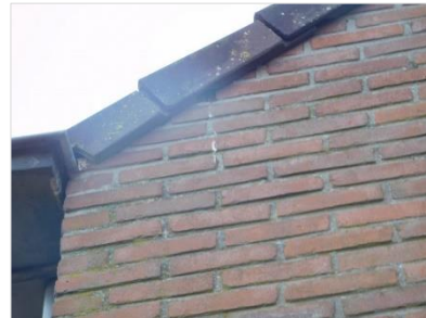
Figuur 5 Overhangende kantpannen met voldoende ruimte voor laatvliegers.