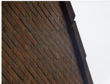
Figuur 4 Overhangende kantpannen met voldoende ruimte voor laatvliegers.