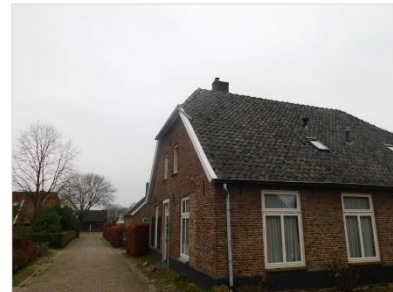
Figuur 8 Woningen in Bronkhorst met wolfsdaken.