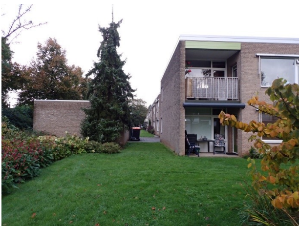
6 gezicht vanaf de kopgevel richting noord. Vrij uitzicht over de gevels