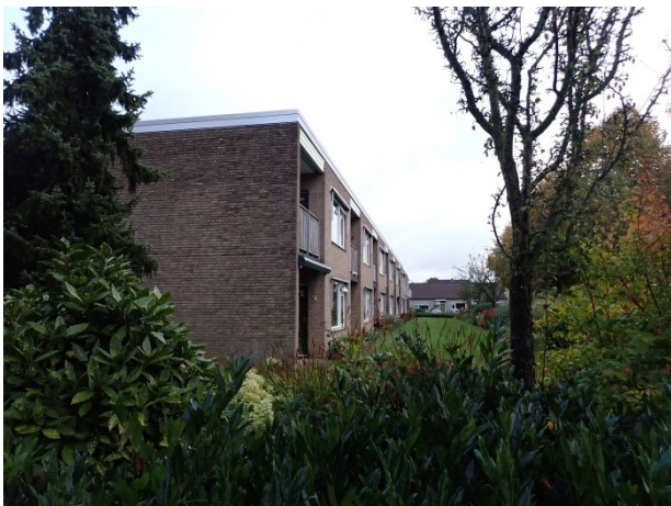
7 gezicht vanaf de kopgevel richting oost (hoogbouw) zuidelijke rij. Vrij uitzicht over de gevels