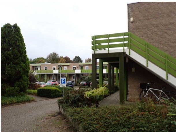
4 gezicht vanaf de kopgevel naar de achterzijde. Vrij uitzicht over de gevels cluster 1 en 2. Om op de foto ook de kopgevel te tonen is de foto iets naar achteren genomen.