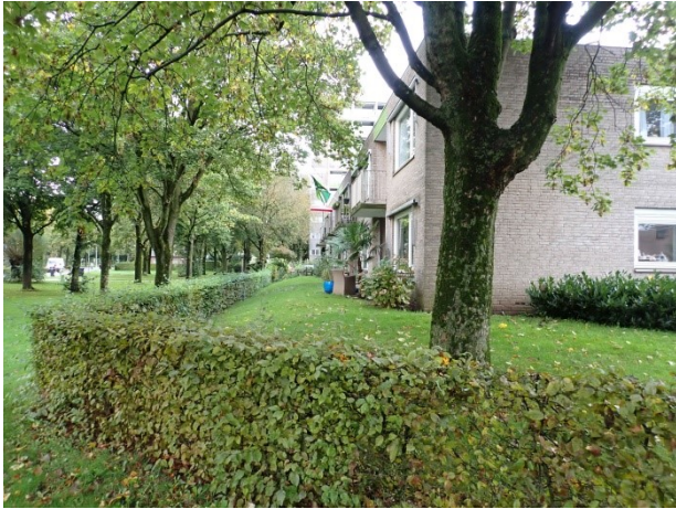
5 gezicht vanaf de kopgevel richting de hoogbouw. Vrij uitzicht over de gevels