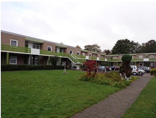
3 gezicht over binnentuin van zuid naar noord Vrij uitzicht over de gevels cluster 1 en 2