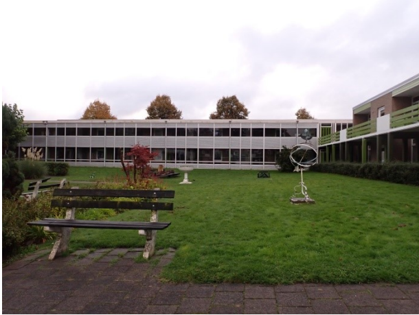
2 gezicht over binnentuin van noord naar zuid Vrij uitzicht over de gevels cluster2 en 3