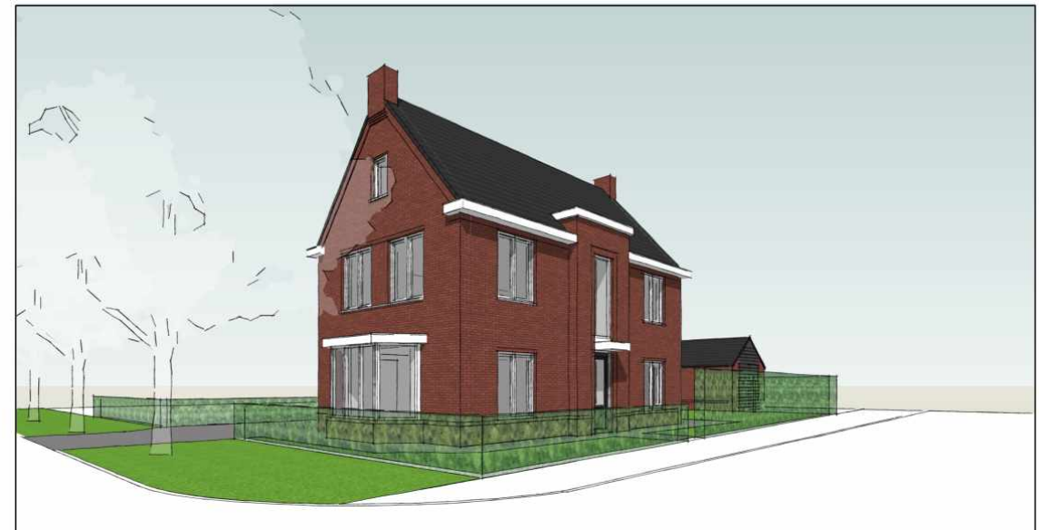
3D IMPRESSIE - SCENE 2