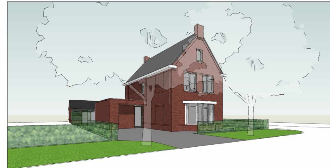
3D IMPRESSIE - SCENE 1