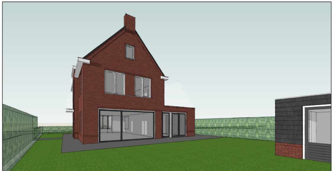
3D IMPRESSIE - SCENE 3