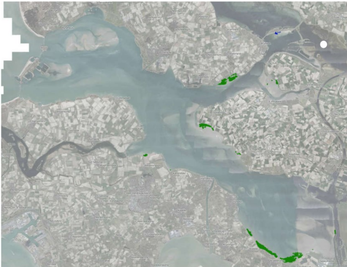
Figuur 11. Verspreiding klein zeegras (groen) en groot zeegras (blauw) in Oosterschelde op basis van zeegraskartering 2023 (RWS dataportaal, geraadpleegd op 18-06-2024).