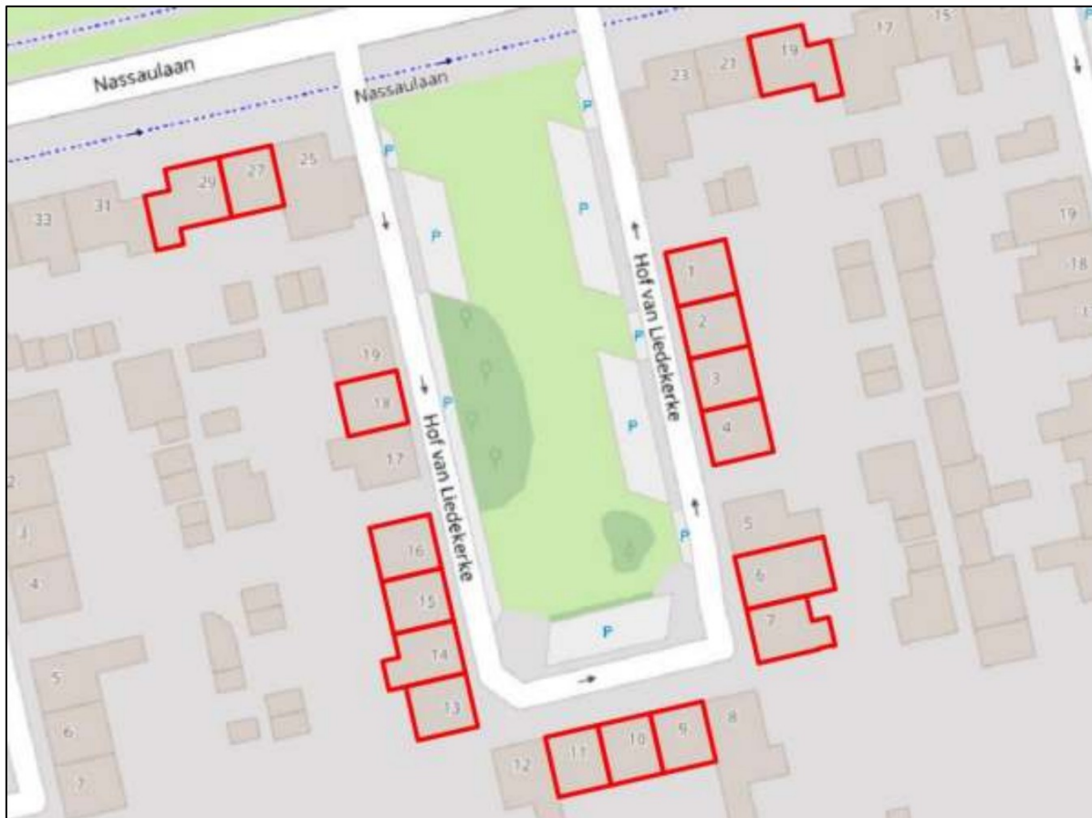
Figuur 1. Overzichtkaart werkzaamheden. De werkzaamheden vinden plaats aan de rood omkaderde woningen.