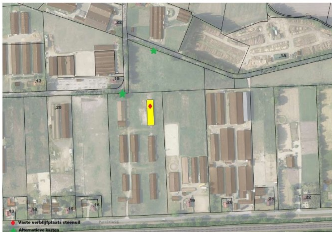
Figuur 2: Locatie alternatieve permanente kasten (groen) ten opzichte van huidig verblijfplaats (rood)