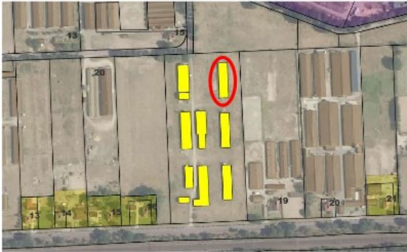
Figuur 1: Ligging plangebied (geel) aan de Parallelweg 16 te Hierden met gevonden verblijfplaats van steenuil (rood)