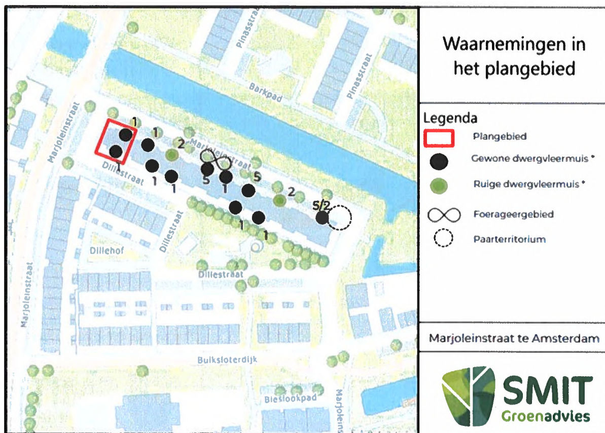
Figuur 1: Weergave van het plangebied (rood omkaderd) en de huidige verblijfplaatsen van de gewone dwergvleermuis en de ruige dwergvleermuis in het gehele complex (1 = zomerverblijfplaats, 2 = paarverblijfplaats, 5 = aantikgedrag). Binnen het plangebied bevinden zich twee zomerverblijfplaatsen van de gewone dwergvleermuis.