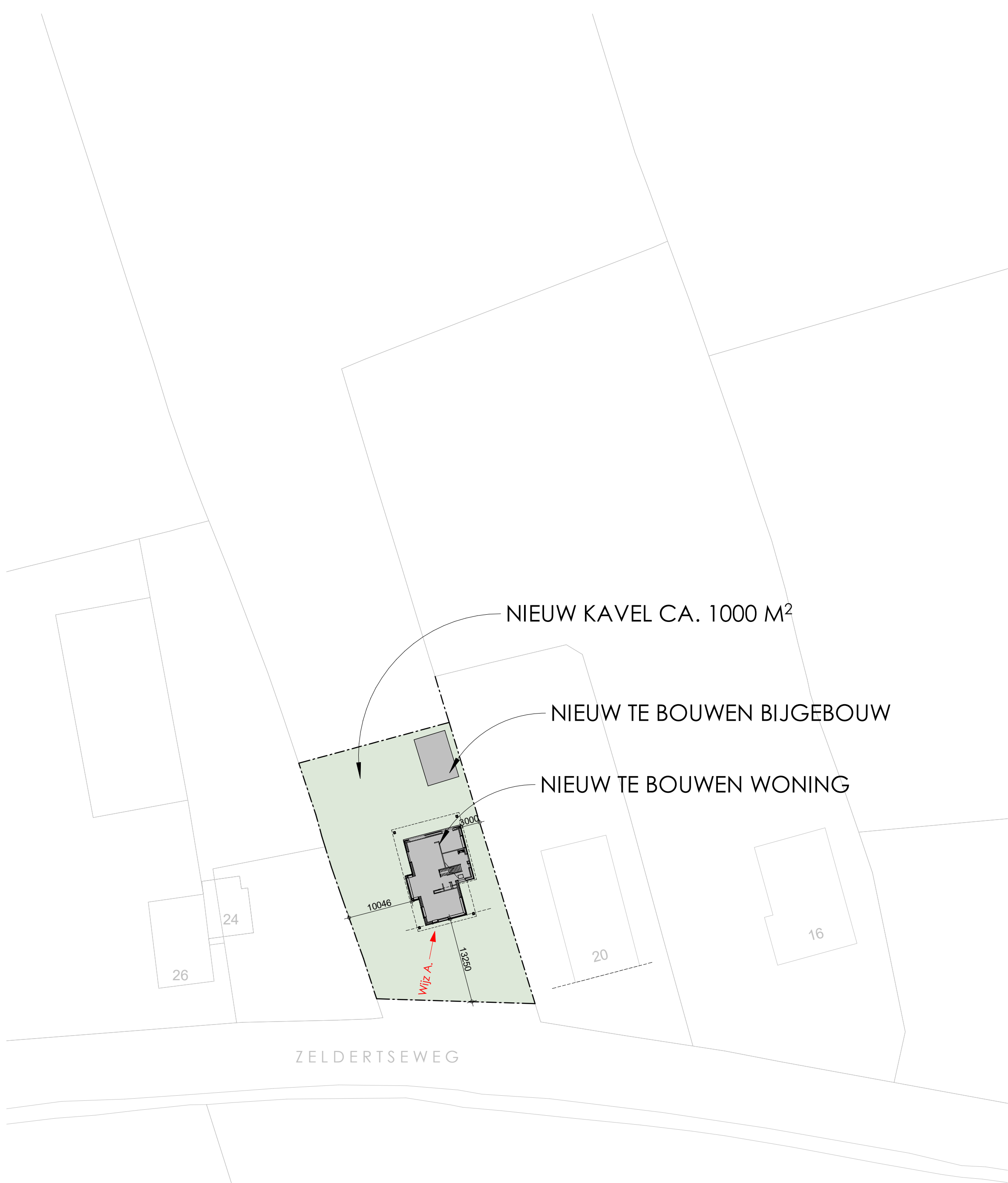
SITUATIE NIEUW 1 : 500

Wijz. A. Woning evenwijzig (zelfde hoek verdraaing) geplaatst t.o.v. Zeldertseweg 20 te Hoogland.