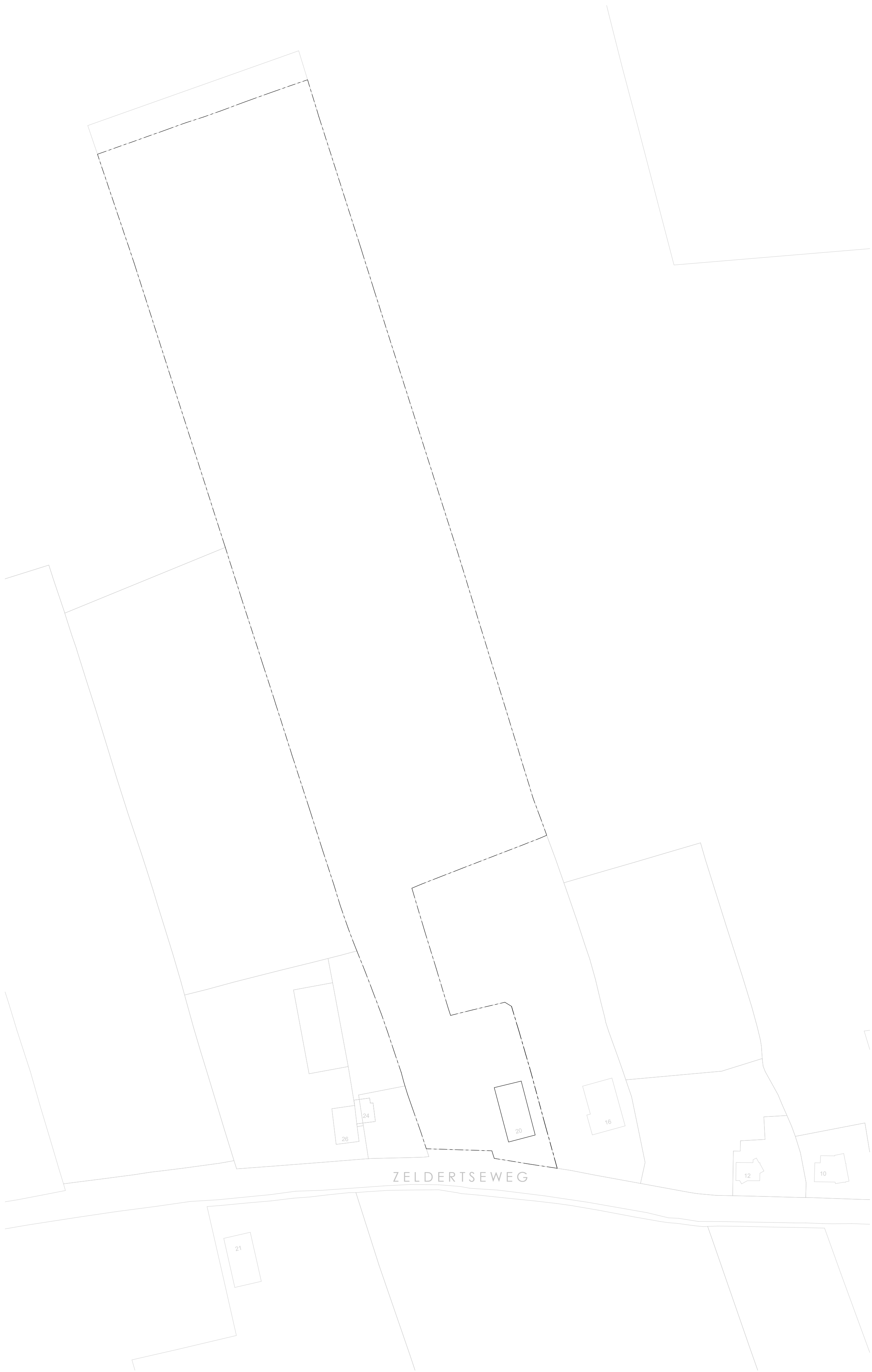
SITUATIE BESTAAND 1 : 1000