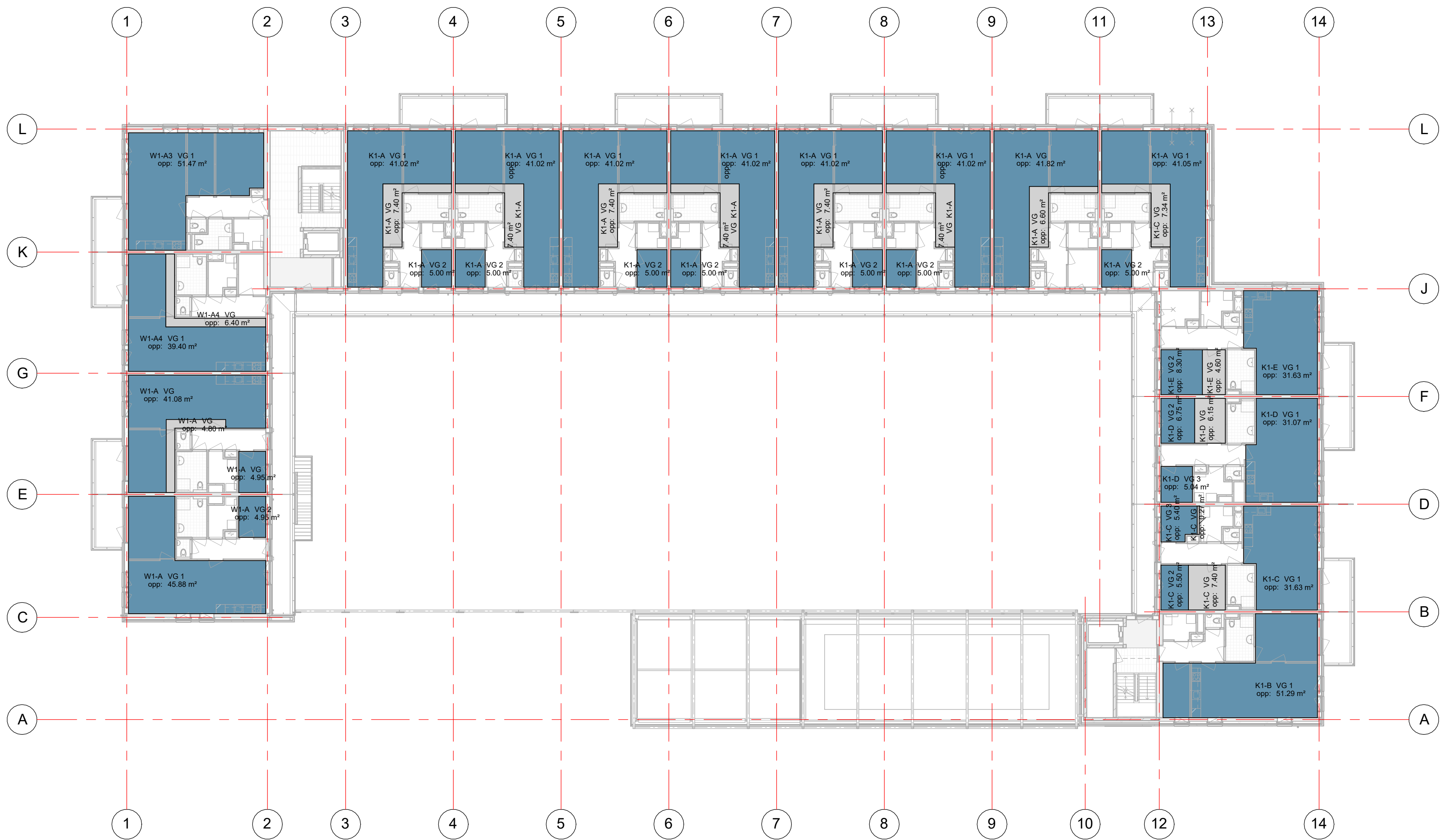
VG 02 tweede verdieping schaal 1 : 200