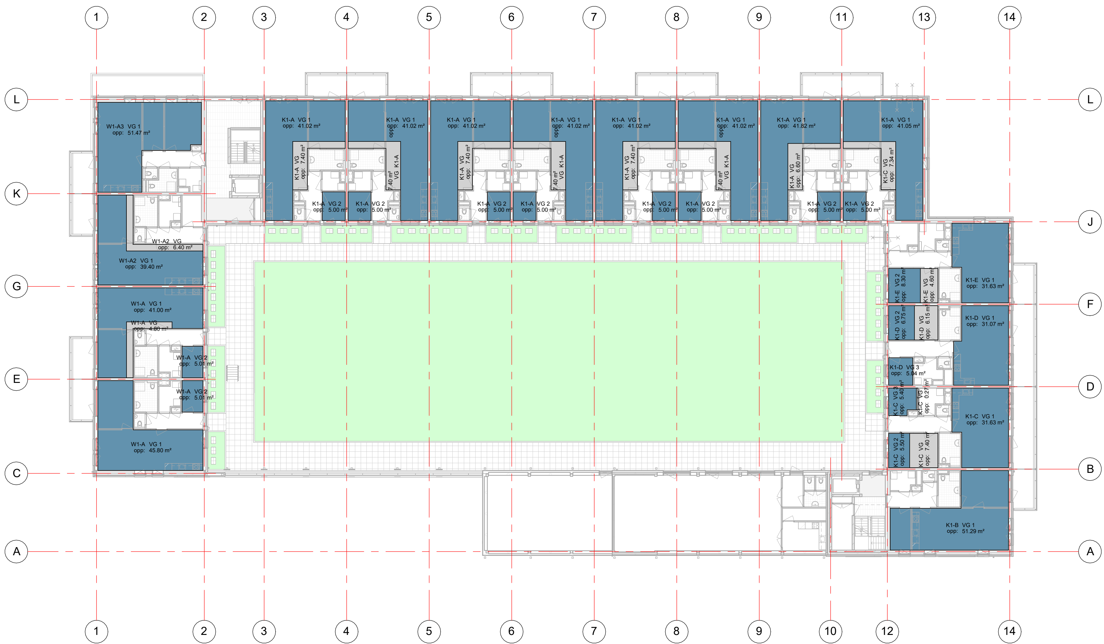
VG 01 eerste verdieping schaal 1 : 200