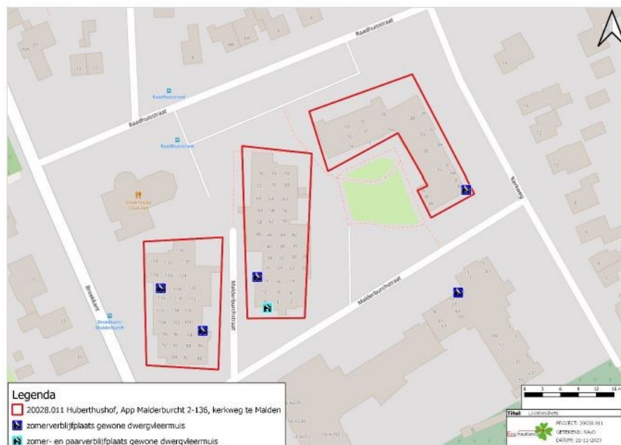
Figuur 2 Vastgestelde verblijfplaatsen van vleermuizen op en rond de onderzoekslocatie