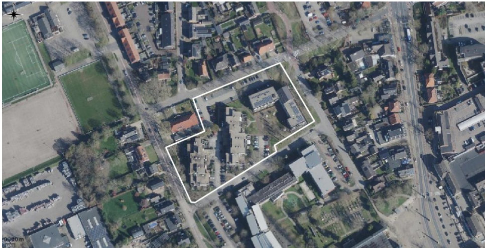
Figuur 1 Luchtfoto onderzoekslocatie (wit omljnd) en directe omgeving