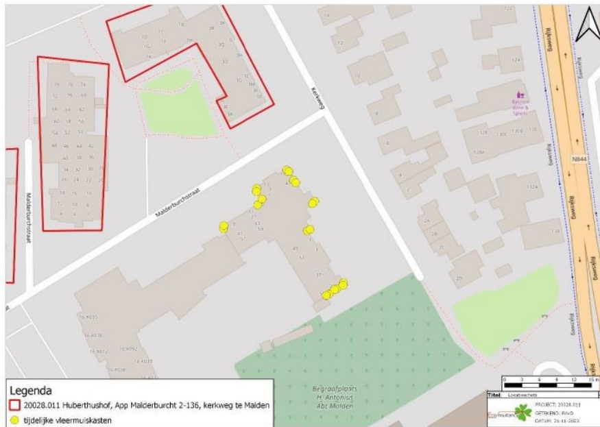
Figuur 3 Tijdelijke 20 kasten voor gewone dwergvleermuis in omgeving