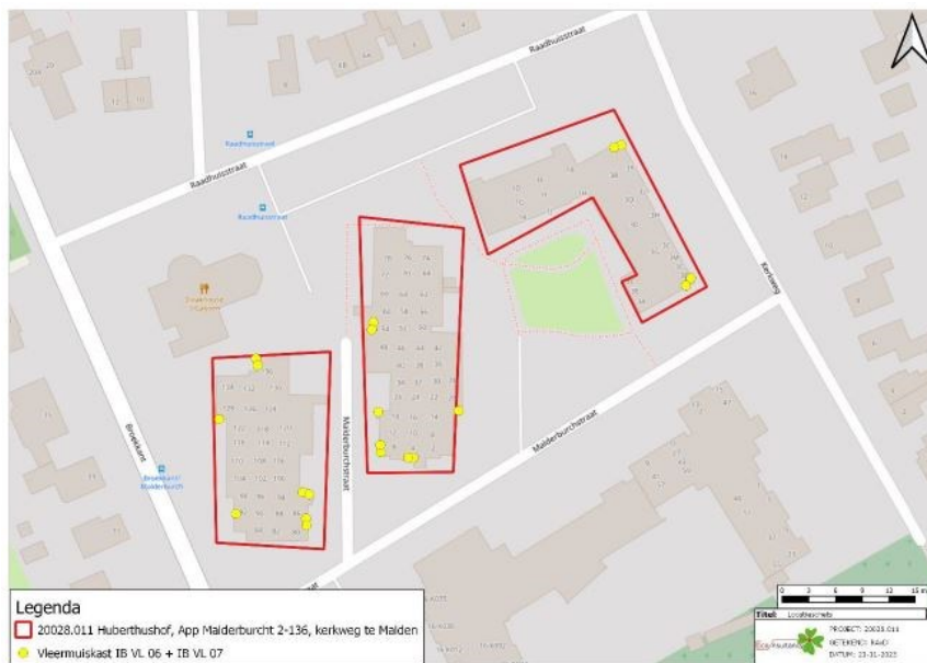
1Figuur 4 Locatie inbouwkasten gewone dwergvleermuis (totaal 20)