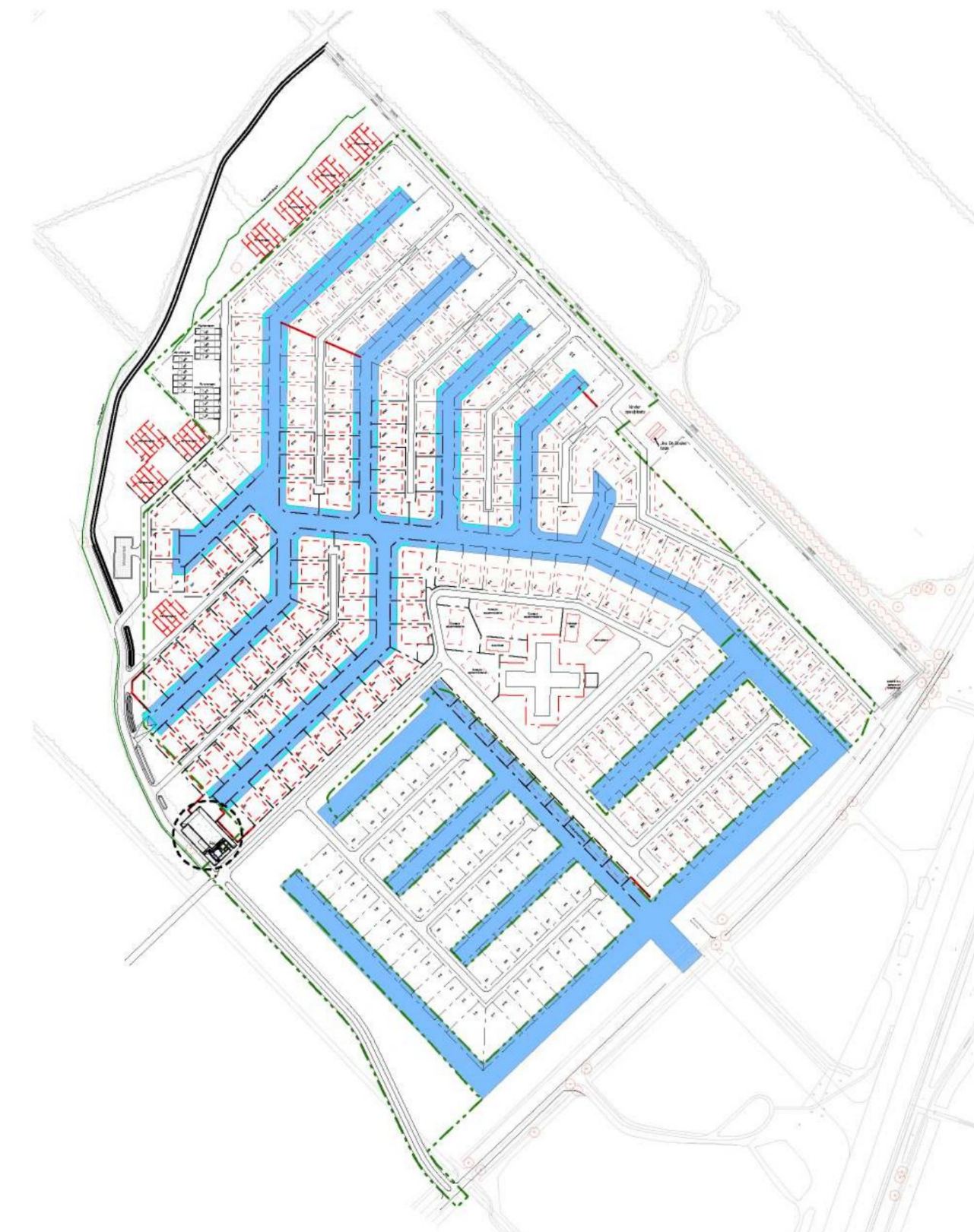
SITUATIE schaal 1 : 5000