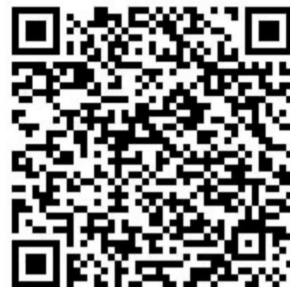
Voor het orgel