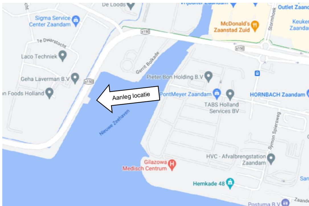
Afbeelding 2: locatie Accommodatie schepen

Ten slotte is er in de bijlage een lijst met telefoonnummers van de personen en instanties welke worden genoemd in dit plan en is er een bijlage met de plattegrond van de locatie, woonplatform en schip.