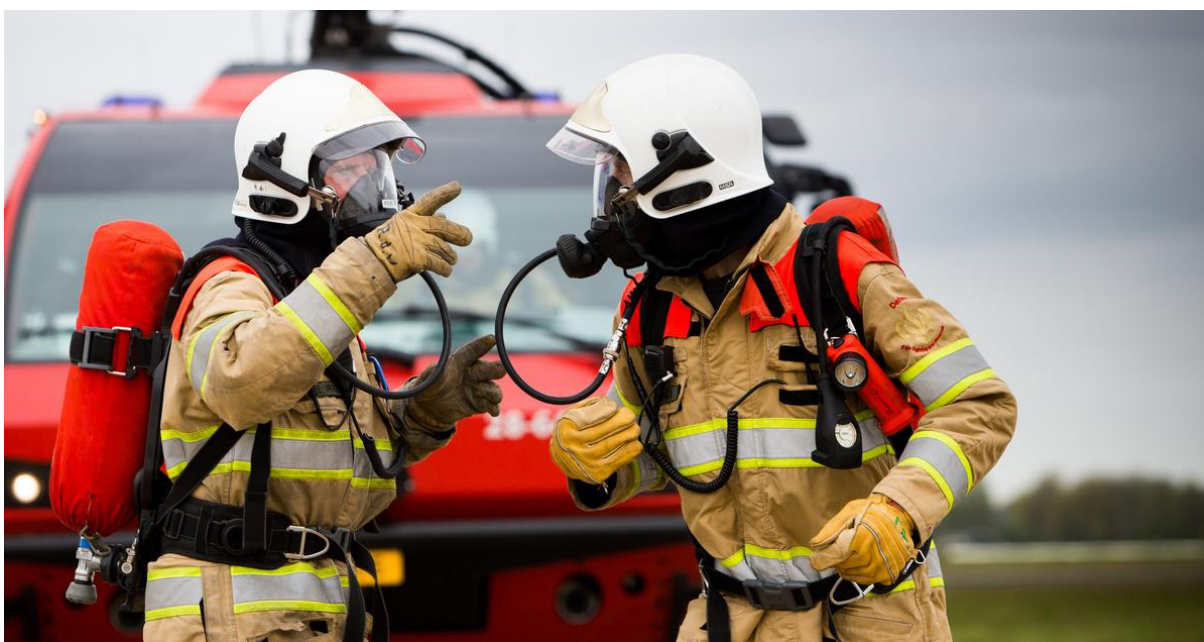
Afbeelding 1: inzet van hulpdiensten.