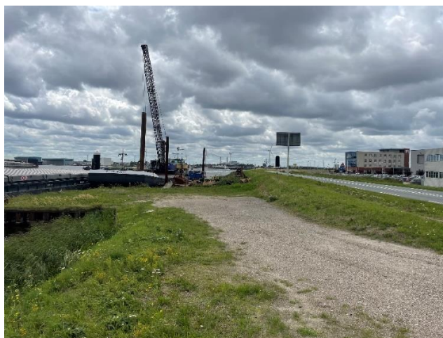
Afbeelding 3:Kade in wording