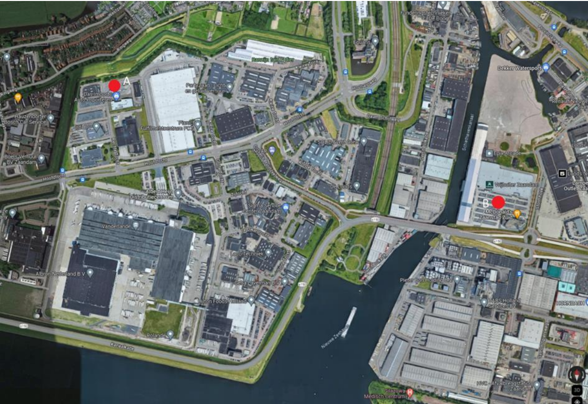
Locatie A: Vrachtwagenterrein bij Truck Cleaning Westerspoor, Rechte Tocht Zaandam Locatie B: Parkeerterrein bij Karwei en McDonald's, Stormhoek Zaandam

COA is in beginsel verantwoordelijk voor het verder opvangen en begeleiden van de bewoners als zij niet snel weer terug kunnen naar de locatie. Denk hierbij aan het verspreiden van bewoners over andere COA locaties met bussen.