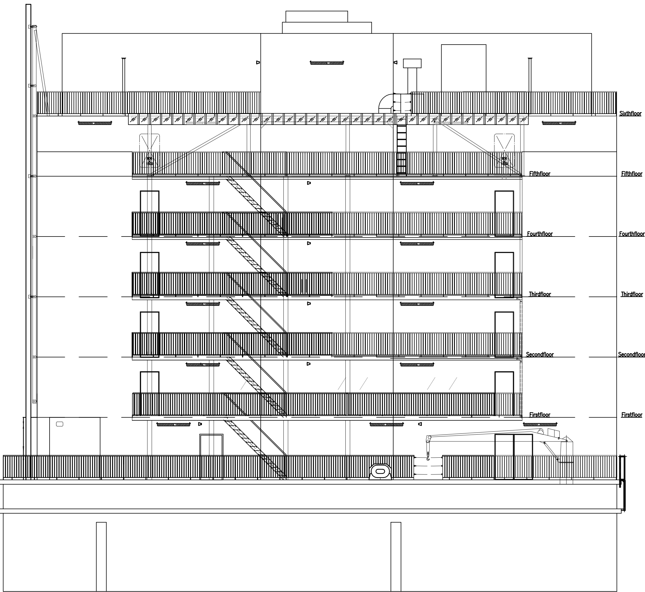
ELEVATION FROM AFT

Voor definitieve brandscheidingen: zie tekeningen en rapportage brandveiligheidsadviseur (SVBB)