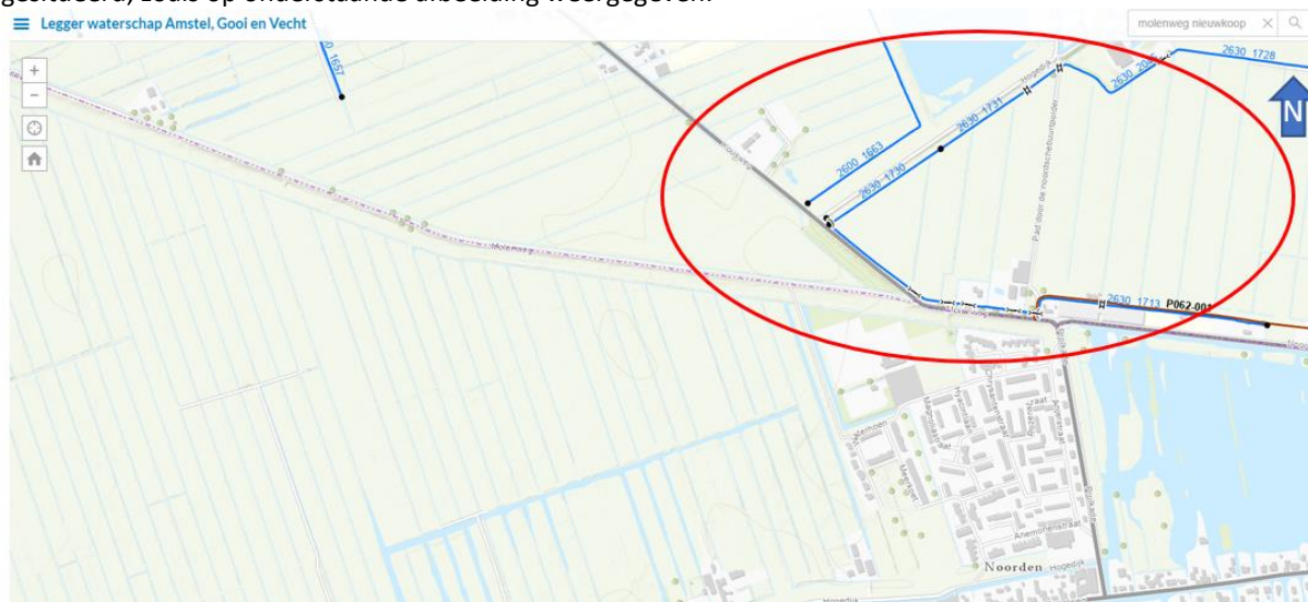
Afbeelding 3 Uitsnede Legger van Waterschap Amstel, Gooi en Vecht

Het her in te richten deel zoals gesitueerd in het beheergebied van Waterschap Amstel, Gooi en Vecht gesitueerd, zoals op onderstaande afbeelding weergegeven.