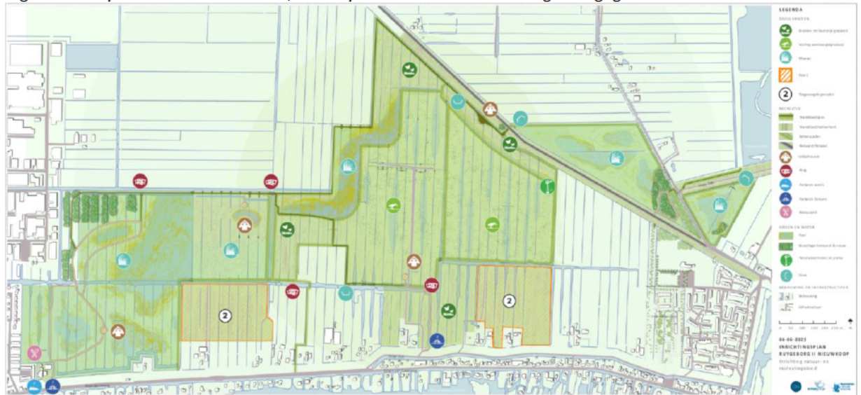
Voor de herinrichting worden sloten en bijbehorende kunstwerken aangepast. Daarnaast wordt het gebied recreatief ingericht, met paden, bruggetjes en vogelkijkpunten.

[REDACTED] [REDACTED] [REDACTED] [REDACTED] [REDACTED] [REDACTED] [REDACTED]