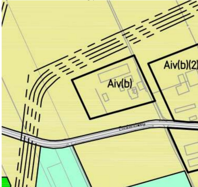
Figuur: uitsnede uit het bestemmingsplan

Ter plaatse geldt het bestemmingsplan "Buitengebied" van de gemeente Ommen dat op 23-03-2010 is vastgesteld door de gemeenteraad.