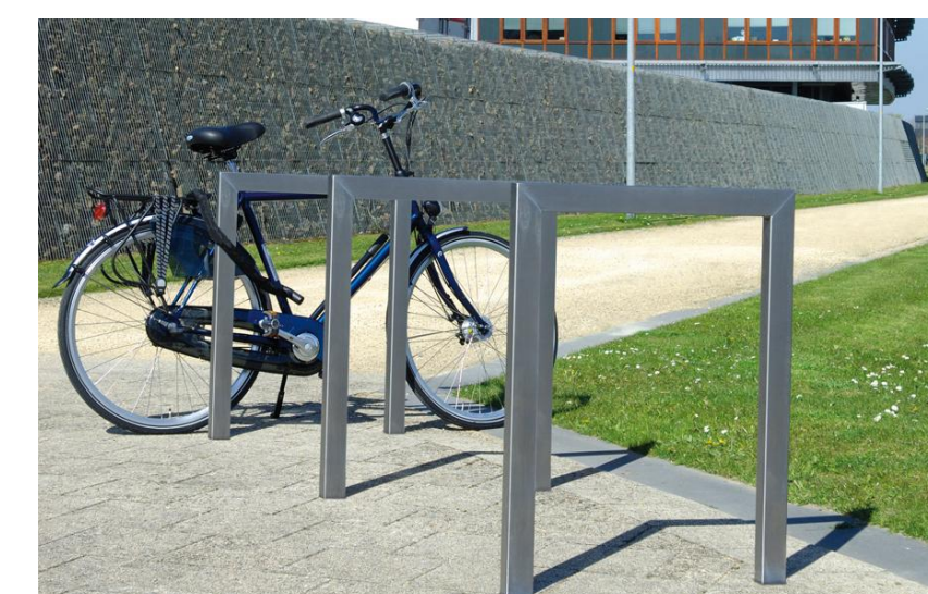
Referentie 1 & 2: Fietsparkeerplekken buiten middels "Fietsnietjes" RVS Type Velopa Scala