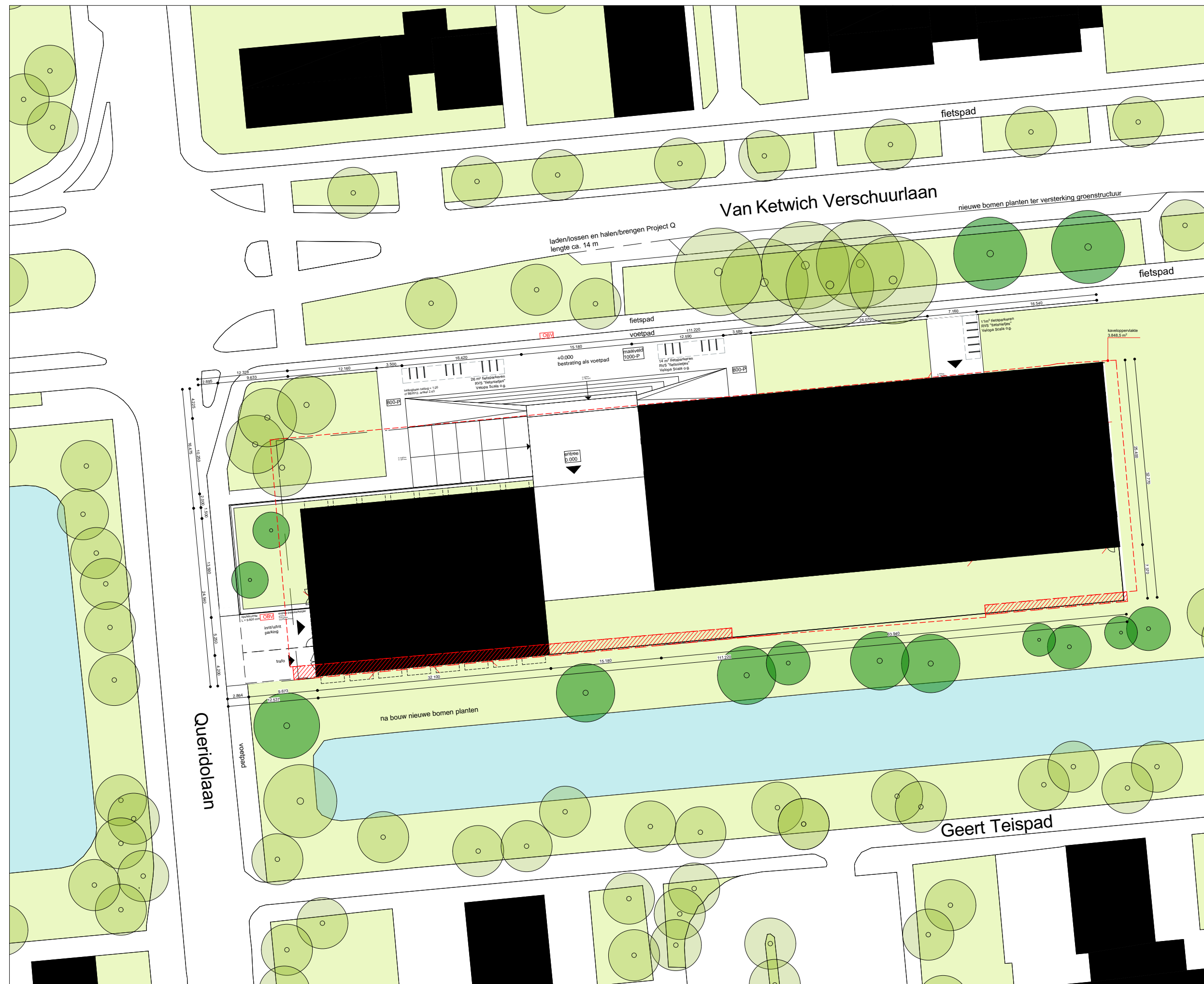
Situatietekening schaal 1:500 ca. 56 m 2 fietsparkeerplekken op openbaar terrein