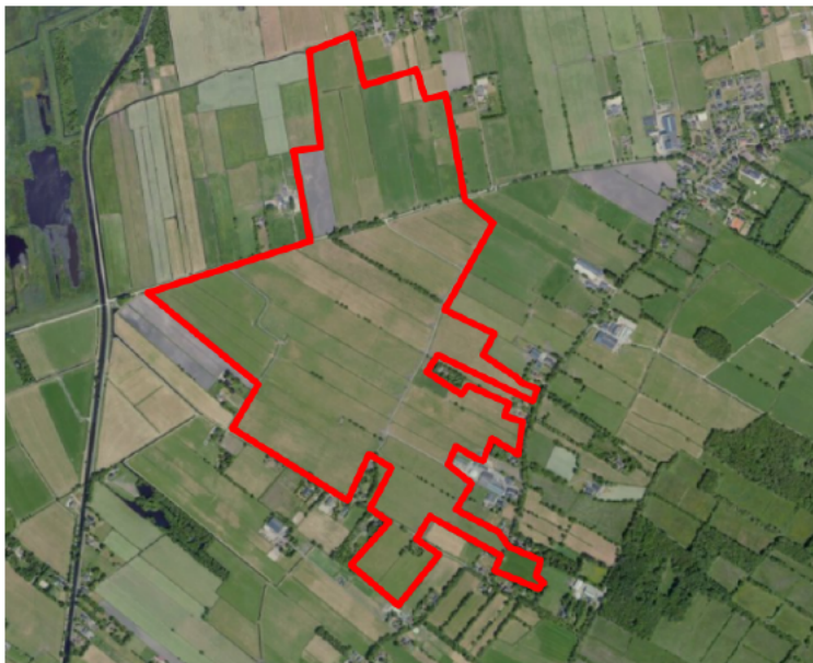
Figuur 1. percelen omgevingsvergunning

Wij hebben besloten op basis van onderstaande motivering aan u op basis van artikel 5.1 lid 2, aanhef en onder g, van de Omgevingswet (Ow) in samenhang met art. 11.37 en art. 11.40 van het Besluit activiteiten leefomgeving (Bal) een omgevingsvergunning te verlenen voor het doden van grauwe ganzen met behulp van geweer ter ondersteuning van de aangebrachte preventieve middelen vanaf één uur voor zonsopkomst ter voorkoming van belangrijke schade aan kwetsbare gewassen op de percelen uit uw aanvraag zoals weergegeven op onderstaande figuur 1.