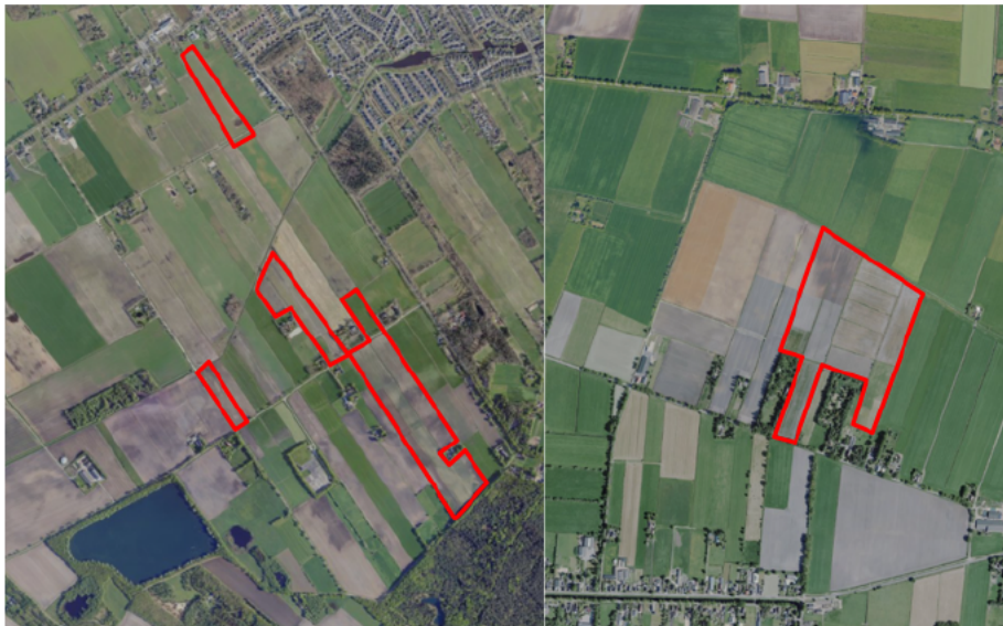
Figuur 1. percelen omgevingsvergunning

Wij hebben besloten op basis van onderstaande motivering aan u op basis van artikel 5.1 lid 2, aanhef en onder g, van de Omgevingswet (Ow) in samenhang met art. 11.37 en art. 11.40 van het Besluit activiteiten leefomgeving (Bal) een omgevingsvergunning te verlenen voor het doden van roeken en kauwen met behulp van geweer ter ondersteuning van de aangebrachte preventieve middelen vanaf één uur voor zonsopkomst ter voorkoming van belangrijke schade aan kwetsbare gewassen op de percelen uit uw aanvraag zoals weergegeven op onderstaande figuur 1.