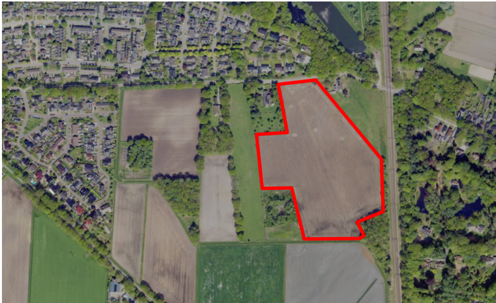
Figuur 1. percelen omgevingsvergunning

Wij hebben besloten op basis van onderstaande motivering aan u op basis van artikel 5.1 lid 2, aanhef en onder g, van de Omgevingswet (Ow) in samenhang met art. 11.37 en art. 11.40 van het Besluit activiteiten leefomgeving (Bal) een omgevingsvergunning te verlenen voor het doden van roeken met behulp van geweer ter ondersteuning van de aangebrachte preventieve middelen vanaf één uur voor zonsopkomst ter voorkoming van belangrijke schade aan kwetsbare gewassen op de percelen uit uw aanvraag zoals weergegeven op onderstaande figuur 1.