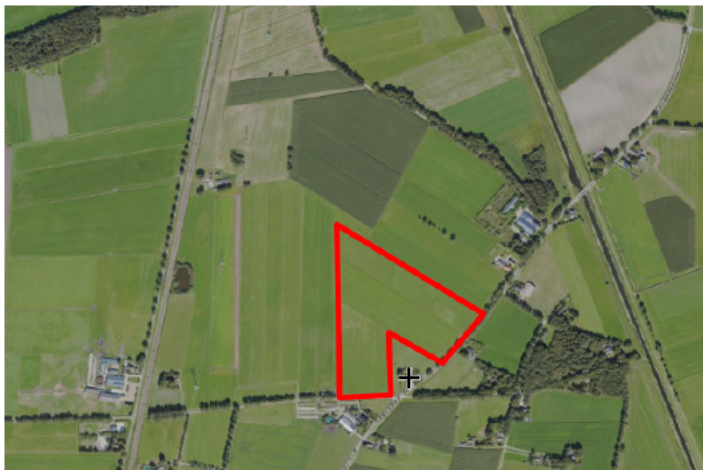
Figuur 1. percelen omgevingsvergunning

Wij hebben besloten op basis van onderstaande motivering aan u op basis van artikel 5.1 lid 2, aanhef en onder g, van de Omgevingswet (Ow) in samenhang met art. 11.37 en art. 11.40 van het Besluit activiteiten leefomgeving (Bal) een omgevingsvergunning te verlenen voor het doden van roeken met behulp van geweer ter ondersteuning van de aangebrachte preventieve middelen vanaf één uur voor zonsopkomst ter voorkoming van belangrijke schade aan kwetsbare gewassen op de percelen uit uw aanvraag zoals weergegeven op onderstaande figuur 1.