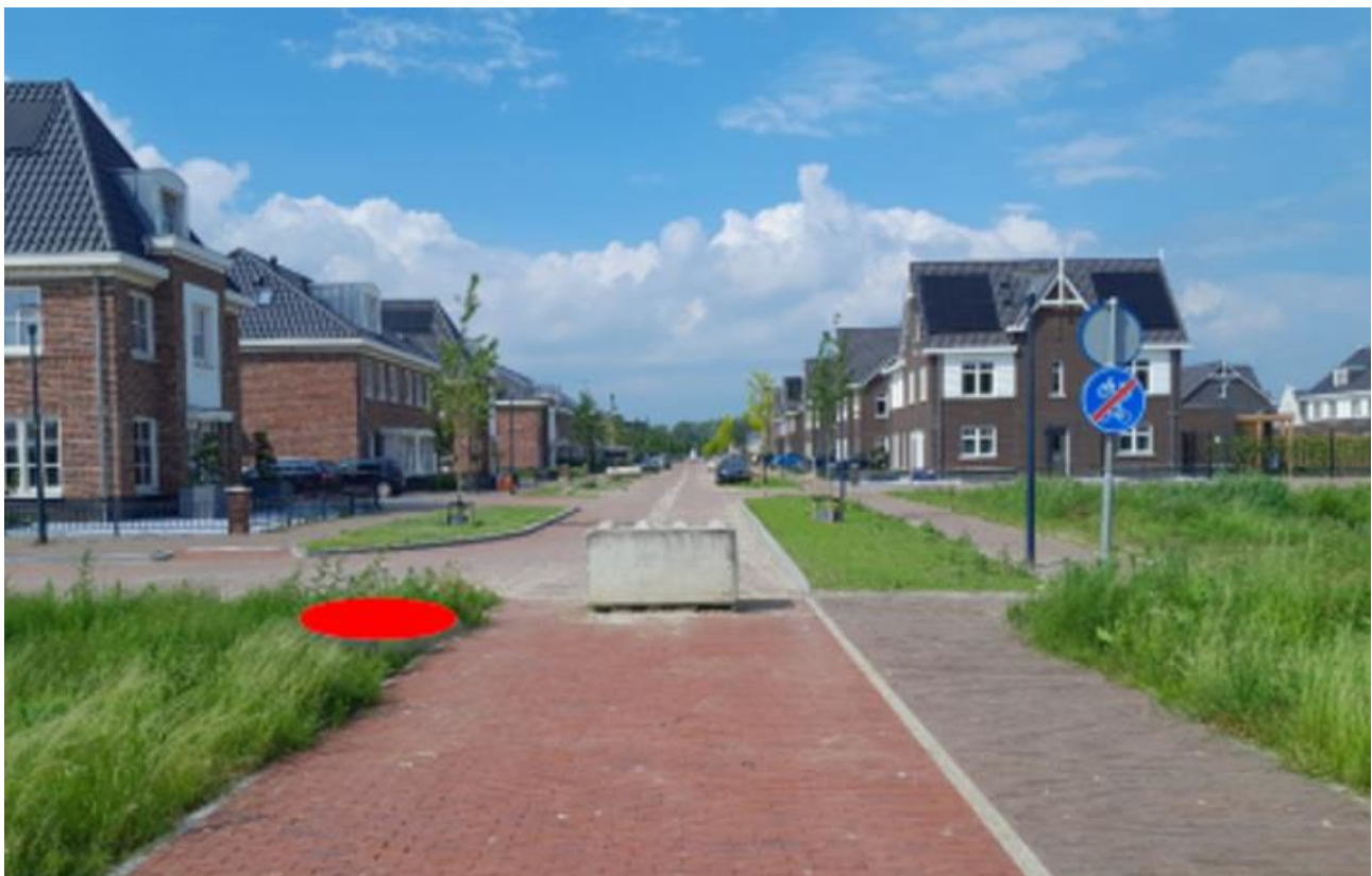
Figuur 2: Omgeving containerlocatie